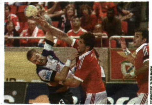
Na Luz > Benfica venceu o FC Porto por 28-27