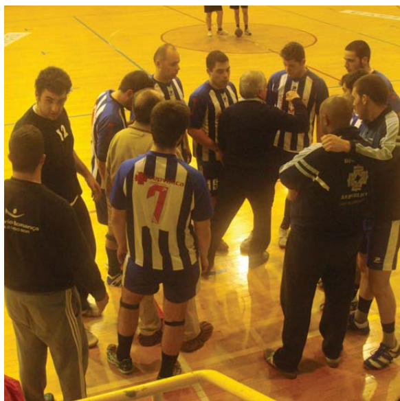
ADA pode fazer mais

Não estão a correr bem as coisas ao andebol da Associação Desportiva Albicastrense (ADA) na 3.ª divisão, fase regular da zona centro. No último sábado, num encontro sempre pautado pelo equilíbrio, a ADA perdeu em casa com a Académica (24-25), diferença mínima que já lhe tinha causado dissabor no anterior jogo em Castelo Branco, com o Empregados do Comércio.