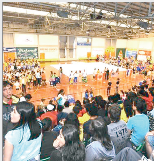
Novos e antigos jogadores juntam-se por uma causa nobre.