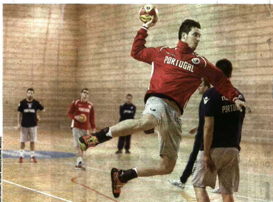
Aplicação Seleção Nacional tem treinado forte para estes jogos com a Suíça