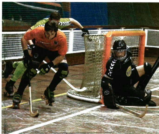
Candelária prejudicado > Os açorianos vão ficar pela quinta vez sem jogar

não raras vezes optam por comer refeições baratas em centros comerciais. No sector feminino, Madeira SAD e Sports Madeira cumpriram a fase regular a fazer jogadas duplas para reduzir despesas e o primeiro destes clubes defende o título nacional fazendo deslocar, normalmente, só dez jogadoras para os compromissos no continente. R.G.