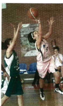
Faltaram CAB Madeira

A Direção da FPB repudiou estes atos, que descredibilizam a competição e solicitou ao Conselho de Disciplina uma urgente decisão acerca do assunto. Para o futuro promete tomar medidas que penalizem as faltas de comparência, de modo a desencorajá-las. C.D.