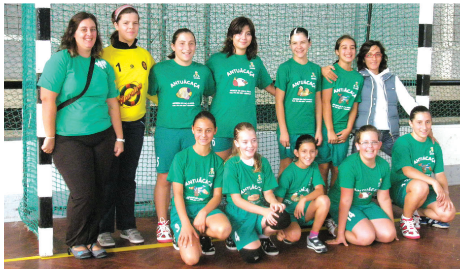
O SALREU vai, com este projecto, ganhar mais jovens para os seus escalões de formação

Captar e formar de forma conjunta atletas Bambis e Minis masculinos e femininos; aumentar o número de praticantes de andebol no concelho; cativar adolescentes para práticas saudáveis; interacção com escolas do 1.º Ciclo, envolvendo os familiares dos jovens nas actividades do clube; potenciar sinergias, competências e recursos; fomentar parcerias entre associações; dinamizar o associativismo; criar maior responsabi-