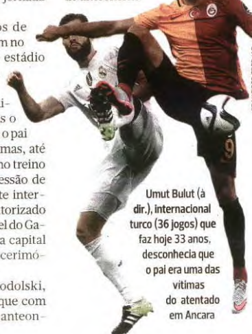
Umut Bulut (à dir.), internacional turco (36 jogos) que faz hoje 33 anos, desconhecia que o pai era uma das vítimas do atentado em Ancara

O primeiro ministro, Ahmet Davutoglu, informou de que foram detidas 20 pessoas por suposto envolvimento no ataque de anteontem.