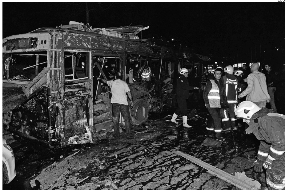
Explosão ocorreu junto a uma paragem de autocarro