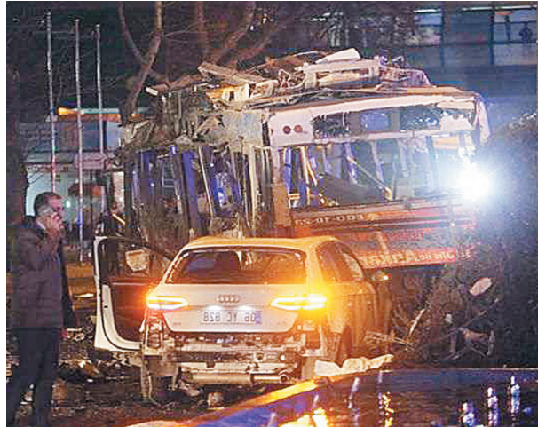
Explosão foi provocada por um carro armadilhado

De acordo com o canal de televisão CNN Türk, os feridos foram levados para clínicas pró-