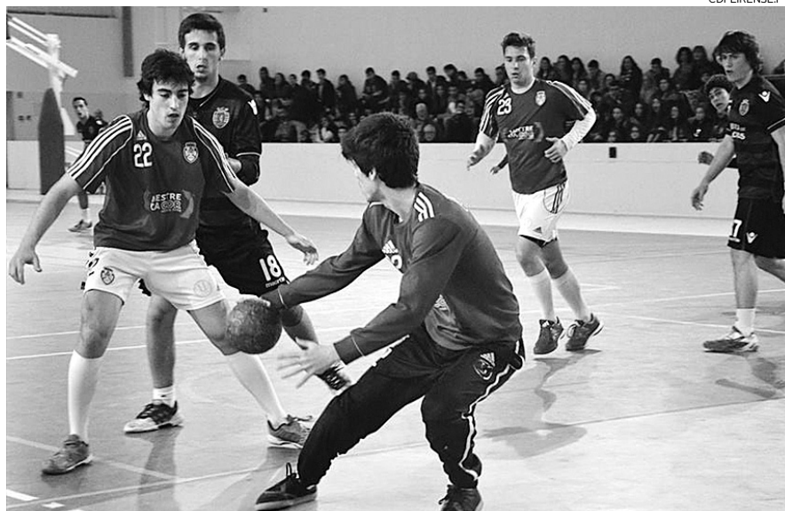
Juvenis do Feirense deram luta ao Sporting, obrigando os “leões” a aplicarem-se para vencer

A equipa de Juvenis do Feirense mostrou que, com um pou-