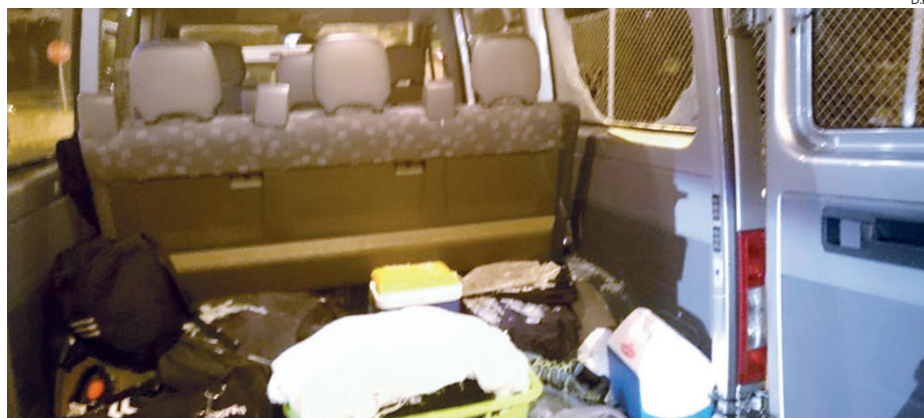
O assaltante partiu os vidros da carrinha para “deitar mão” a sacos dos jogadores

A associação referiu ter ficado “duplamente triste”, já que nesse dia perdera o jogo contra o