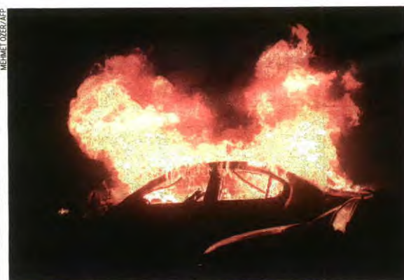
Carro bomba explodiu numa das artérias da capital, espalhando tragédia e pânico