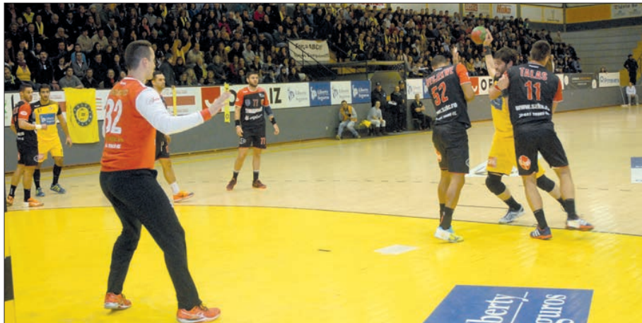
ABC vai tentar garantir, esta tarde e em casa, uma vantagem confortável

O ponto de mira está nas meias-finais da Taça Challenge, ponte para a desejada final da competição e em que há a esperança, ao contrário do ano passado, de levantar o troféu. O ABC/UMinho reencontra esta tarde, a partir das