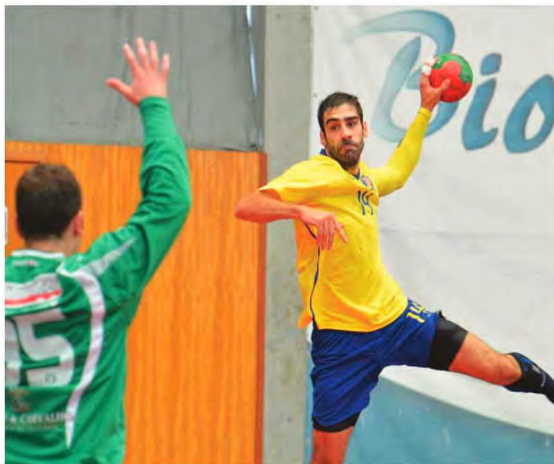
O Madeira Andebol conquista lugar na final-four da Taça.

O intervalo aliás veio na melhor altura, pois durante os primeiros