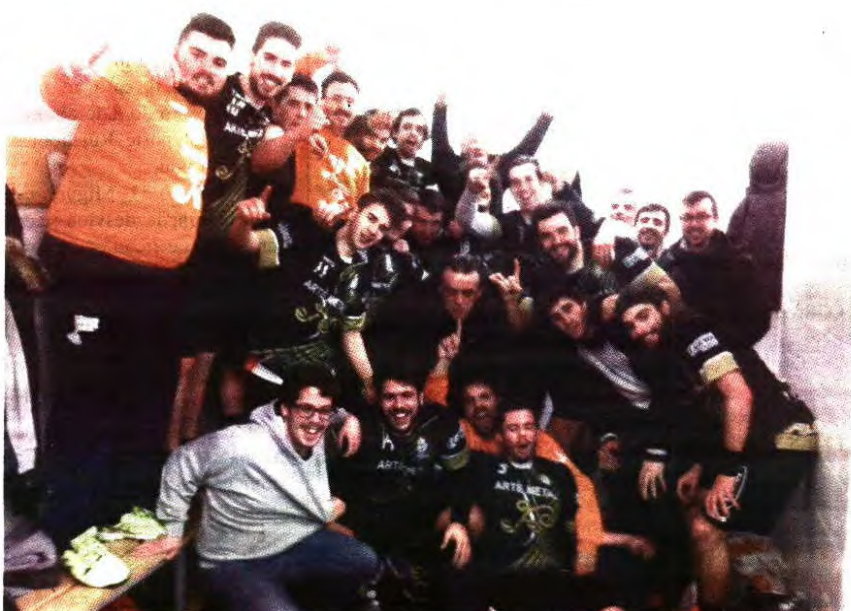
Equipa de andebol está em grande plano

Os jogos da segunda fase da III divisão nacional serão realizados aos sábados no Pavilhão da Escola Secundária da Póvoa de Lanhoso.