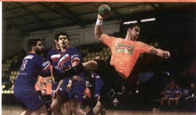
Malatos do Águas Santas eliminaram o Passos Manuel (37-26) e seguem em frente na Taça

Ilhavo (2.ª)-Col. Gaia 16-39; Canelas (2.ª)-Malastars 20-44; Juve Mar (2.ª)-Col. J. Barros 20-22; Sp. Madeira-P. Manuel 35-22; CB C. Branco (2.ª)-Juve Lis 22-34; SIR 1.ª Maio (2.ª)-SB Messines (2.ª) 30-20; Vermoim (2.ª)-CALE 15-39; Almada (2.ª)-Modicus (2.ª) 15-27; P. Alto (2.ª)-Cister (2.ª) 21-24; V. Távira (2.ª)-Alavarium 15-31; Académico (2.ª)-Salreu (2.ª) 35-11; Lusitanos (2.ª)-Alpendorada 32-35; SF Marinha (2.ª)-Didaxis (2.ª) 25-21 e Infesta (2.ª)-Assomada 16-40