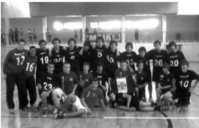
Os iniciados do Académico que venceram na Maia.

Recorde-se que a equipa de minis do Santanense também venceu a sua categoria.