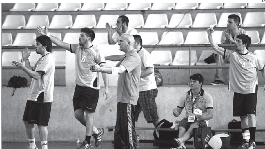
O banco da UMinho (em andebol) festeja a vitória

O conjunto espanhol foi realmente mais forte que o português, mas a partida foi muito equilibrada durante a primeira parte (2-3). No segundo tempo os de Málaga entraram melhor e conseguiram apontar muito cedo dois golos, o que levou o técnico minhoto a colocar a equipa a jogar