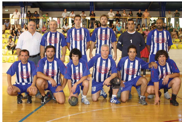
República Team conquistou o torneio

ADA reavivou a chama do torneio popular de andebol. Em boa hora o fez. Várias gerações de praticantes a jogarem e muita gente a acompanhar nas bancadas.