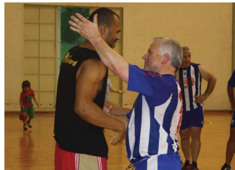
António Mata ainda vai a jogo