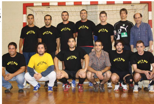
Bell's Bar acordou tarde na final