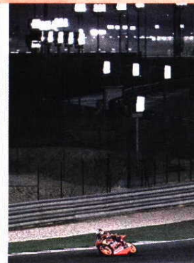
Circuito de Losail já é muito conhecido