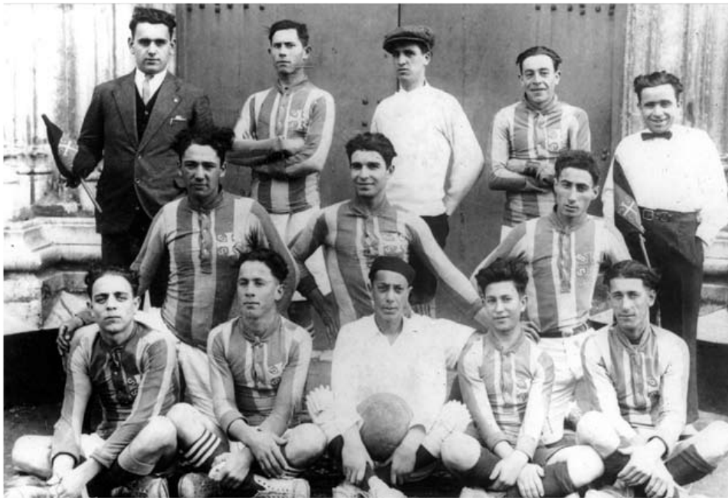
CLUBE que deu origem ao Sport Clube Praiense, baluarte do desporto terceirense e açoriano

A exemplo do que já aconteceu com outros emblemas históricos do desporto terceirense, DI dá hoje a conhecer o historial do Sport Clube Praiense.