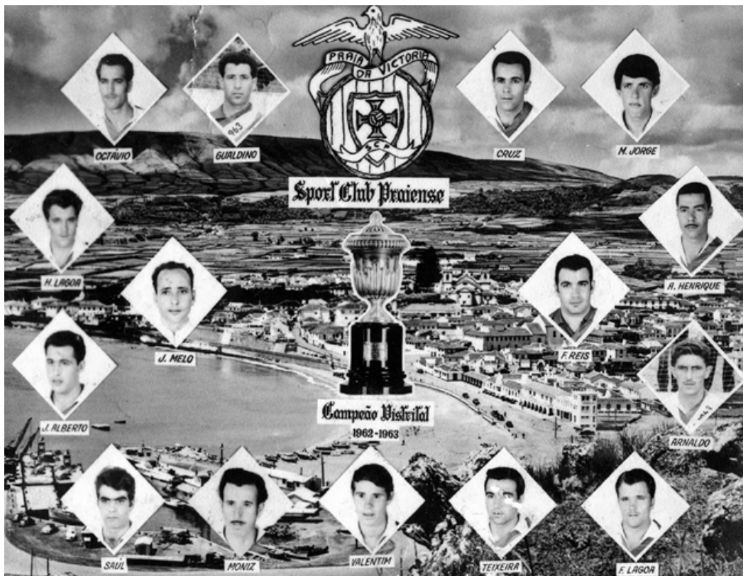
EQUIPA DO SPORT CLUBE PRAIENSE campeã distrital da AFAH na temporada desportiva de 1962-63