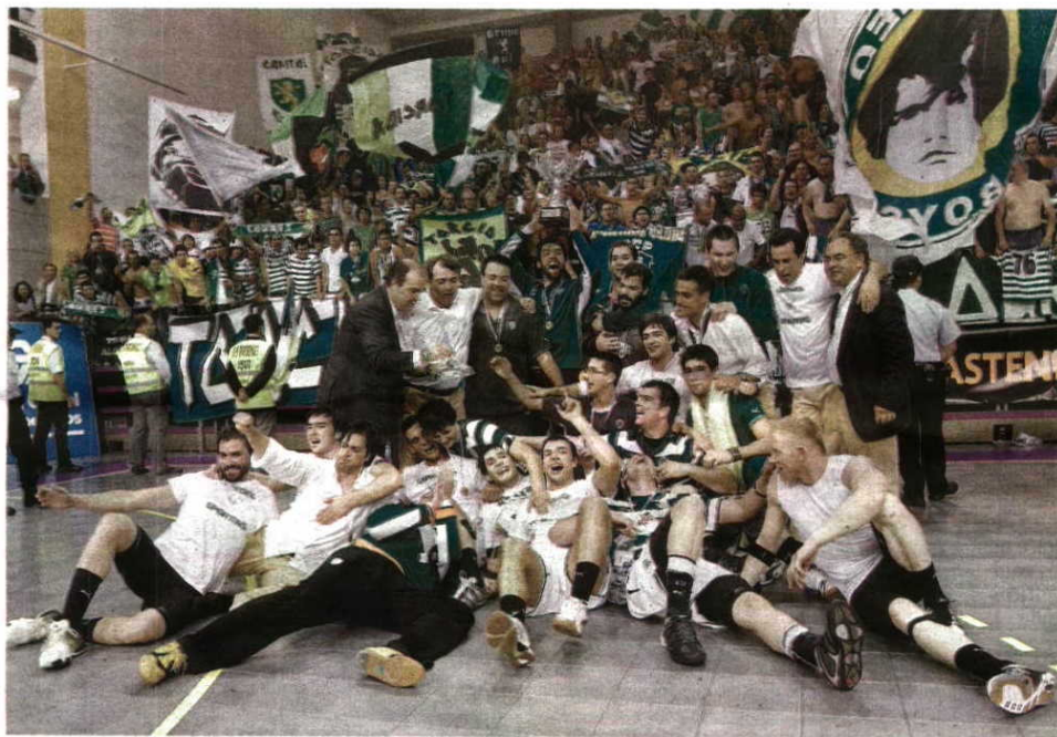
Em 2010 - Sporting festejou conquista da Taça Challenge em casa

jogadores que venceram a Taça Challenge, o Sporting volta a sonhar com uma final, apesar de se tratar da quarta prova da hierarquia europeia. Mas as ambições do Sporting não se limitam a esta competição, pois está ainda na luta pela Taça de Portugal – nas meias-finais defrontará o Belenenses – e pelo título nacional – é segundo, com 32