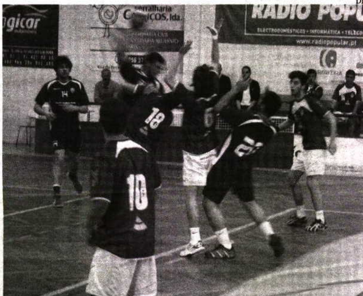
Feirense e CDC S. Paio de Oleiros empatam em Juniores

Os juniores de Feirense e CDC S. Paio de Oleiros proporcionaram um excelente espectáculo. Cerca de 175 espectadores vibraram com um jogo equilibrado, bem disputado e emotivo até ao último segundo, e que terminou com um empate a 23 golos. Os guarda-redes estiveram em bom plano e foram eles que evitaram que o adversário descolasse no marcador. Ao intervalo 12-11 para os blues. Na segunda metade, a velocidade parecia ser a solução mas logo o fio de jogo retomou as jogadas mais elaboradas a partir da circulação de bola. De parte a parte, alguma falta de pontaria na hora de fazer golo que atirou ambas as formações para um empate final. O CDC S. Paio de Oleiros foi melhor a marcar na segunda parte (11-12) e esteve mesmo a vencer a menos de um minuto. Mas uma perda de bola no ataque oleirense permitiu uma última reacção fogaceira e o empate justo no jogo.