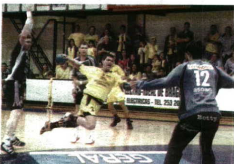
Em 2005 - ABC foi eliminado pelo Wacker Thun