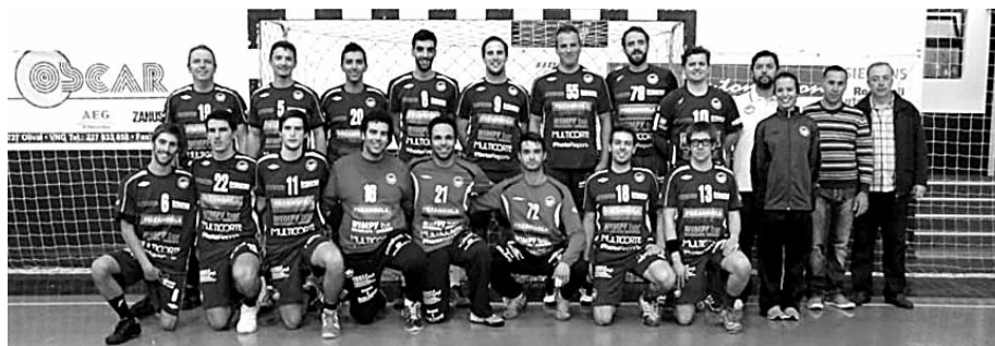
Modicus arranca o campeonato com grandes expetativas