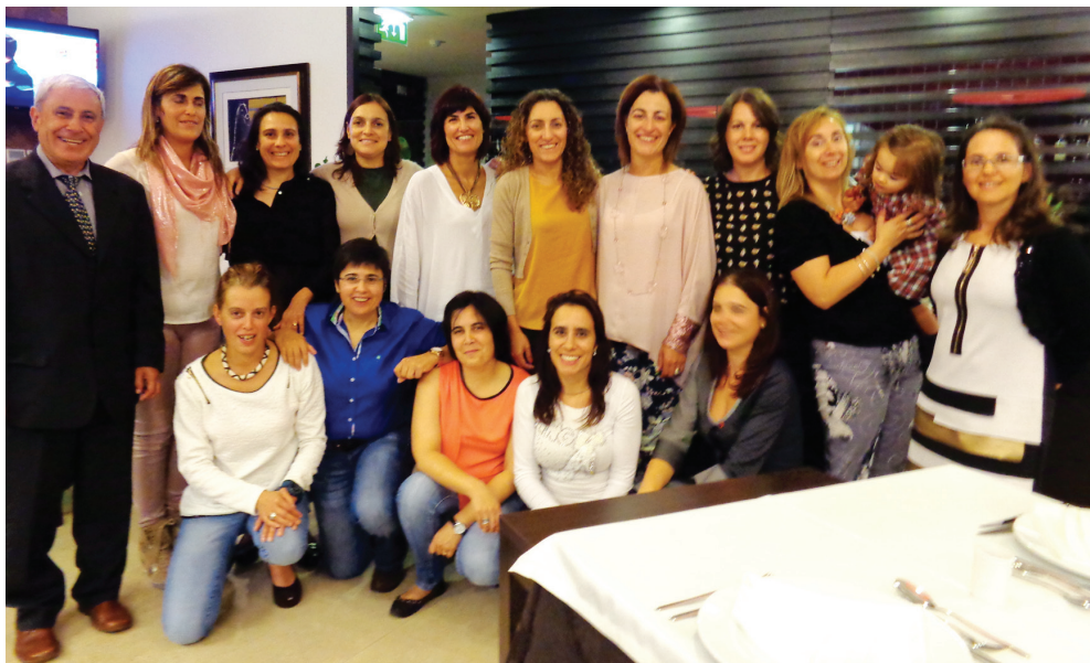
Atletas da última equipa feminina de andebol em Barrô