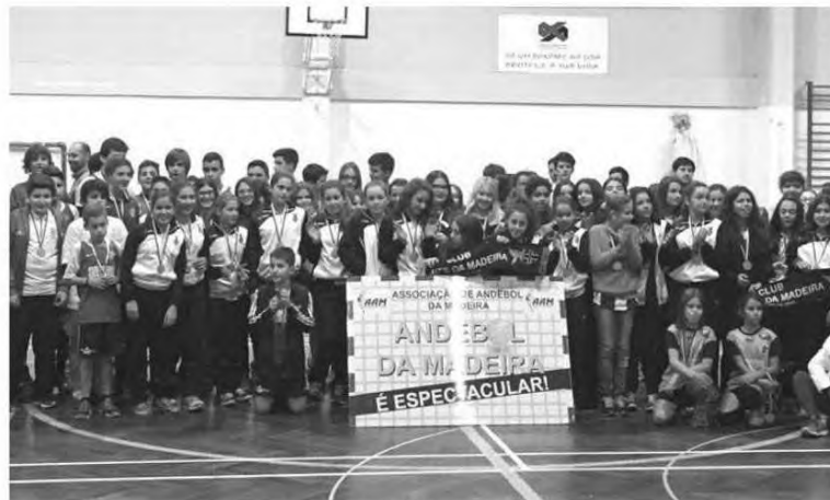
Torneio em concentração de infantis 'O colmo' foi um sucesso.

mos regionais. Ao todo foram cerca de 120 jovens atletas que ao longo de dois dias disputaram inúmeros jogos, tendo sempre como objectivo primordial o fair-play e o enorme convívio entre os atletas das várias equipas. Quanto aos vencedores no escalão feminino a equipa do CD Madeira A triunfou, enquanto nos masculinos a vitória sorriu à Bartolomeu Perestrelo.