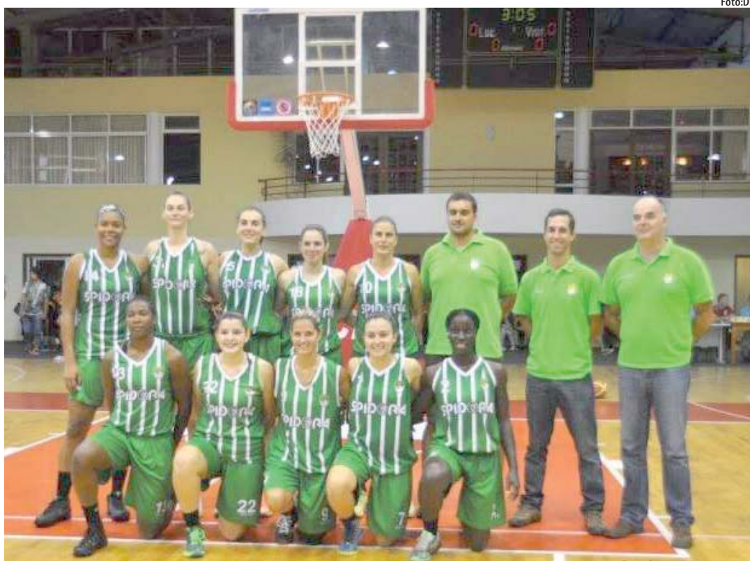
... e o presente!

Sem deixar morrer as saudades do passado, temos de aplaudir o presente, já que o futuro é incerto.