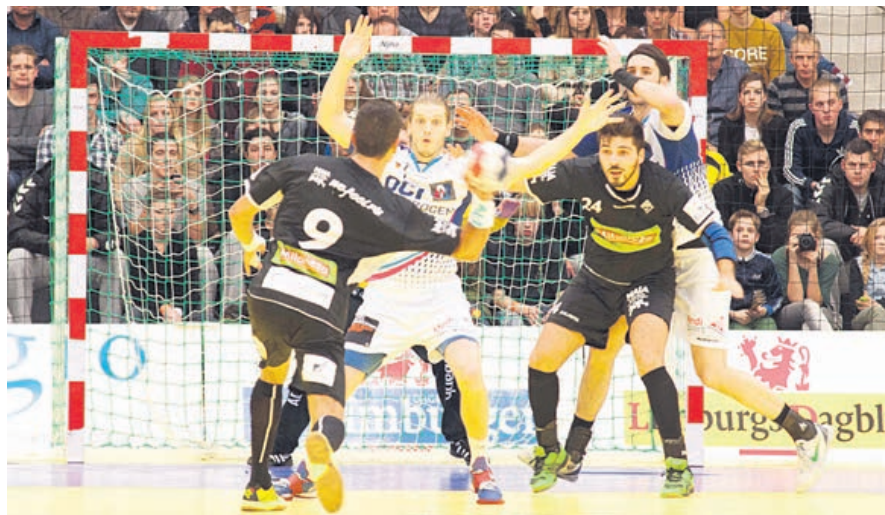
Águas Santas venceu este torneio em 2013 (na foto) e FC Porto venceu em 2012

Segunda-feira, o clube minhoto já vai encontrar-se, também dependendo dos resultados dos primeiros jogos, com clubes que