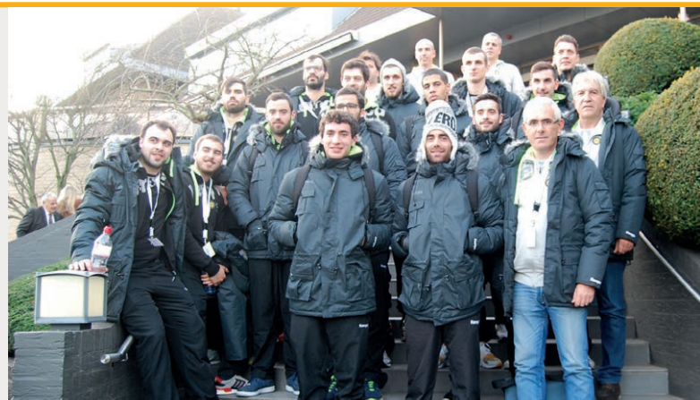
Comitiva do ABC/UMinho já está na Holanda