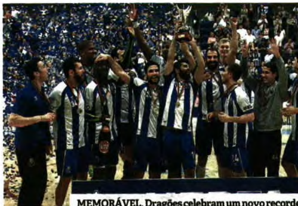
MEMORÁVEL. Dragões celebram um novo recorde

Destaque ainda para a campanha dos dragões na