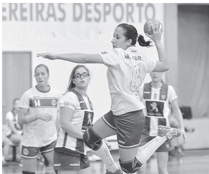
Madeira SAD é o detentor da Taça de Portugal de Andebol feminino.

Nos jogos entre equipas de diferentes escalões, a Juve Lis recebe o CA St. Félix Marinha, o Académico FC a jogar em casa com o Alavarium Love Tiles, o Colégio de Gaia a receber o Modicus Sandim e o CA Leça des-