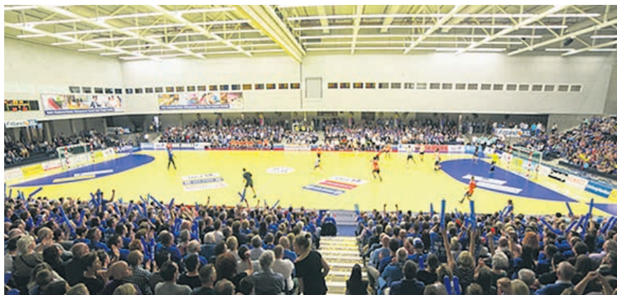
Torneio Limburgse Handbal Dagen decorre no Fitland XL Sittard, uma obra recente