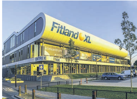
Aspecto exterior do recinto dos jogos