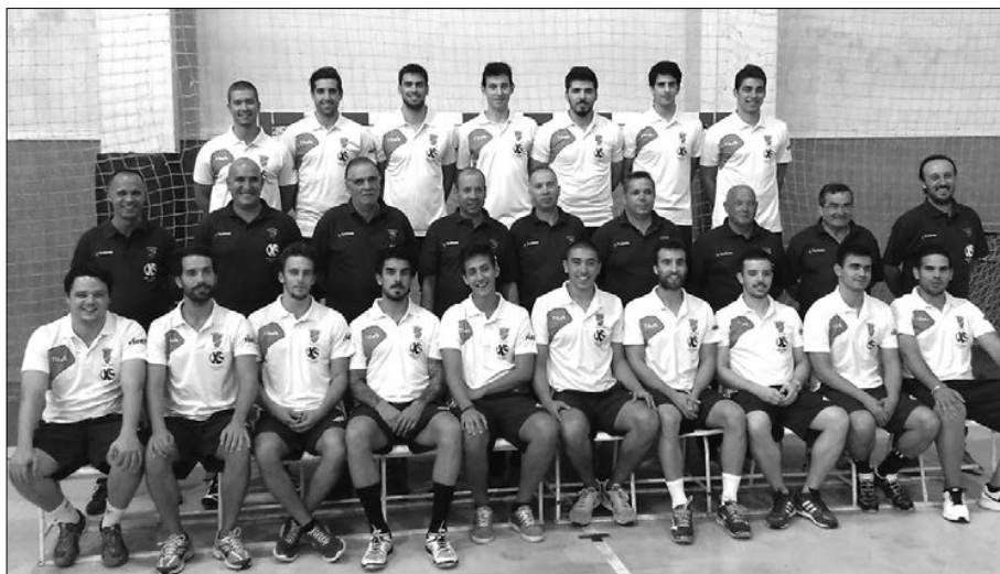
Seniores do Arsenal da Devesa disputam a II Divisão nacional