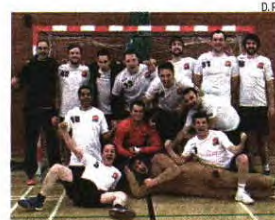
Lions e a sua mascote em festa

«Jogava no Belenenses e ganhava 150 euros. O passe de Setúbal para Lisboa custava 151, ainda pagava 1 euro para treinar. Em 2013, desespereado porque não conseguia emprego e o andebol também não dava, abri um café com a minha mãe, em Setúbal, e arranji um emprego a transportar doentes. A recibos verdes e com salário mínimo. Um dia es-