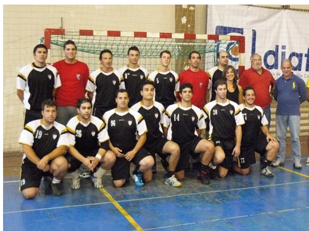
EQUIPA VISEENSE é séria candidata à subida de divisão

Numa tentativa de fuga aos últimos lugares, a Associação Desportiva Albicastrense obrigou o Batalha Andebol Clube a "tremer" em casa. O resultado final foi de apenas um gol de diferença e alcançado nos últimos segundos do jogo. A equipa do distrito de Leiria tem feito