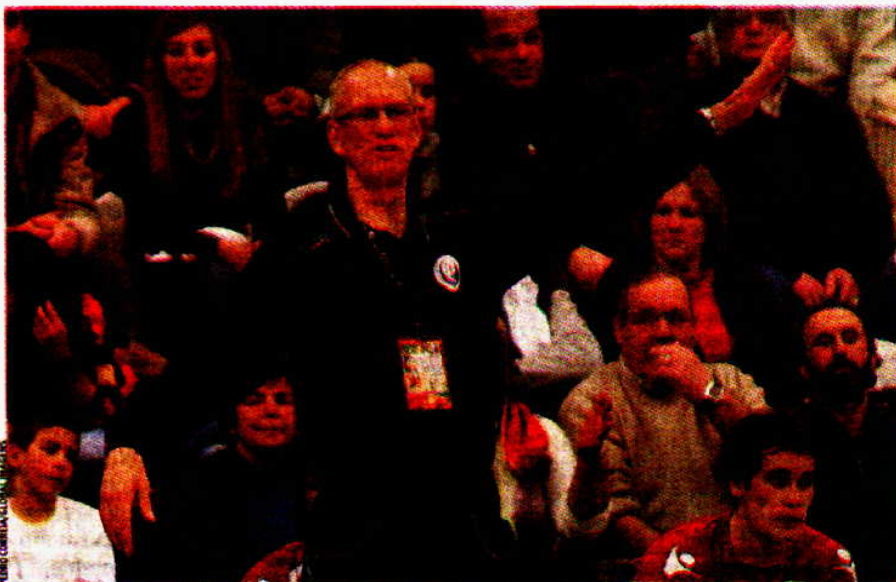
Mats Olsson • Seleccionador nacional nasceu a 12 de Janeiro de 1960, em Malmö

Será o 102º jogo de Olsson como técnico principal da Selecção Nacional – já estava em Portugal, como adjunto, desde 2001 –, somando nesta altura, em 101 jogos, 43 vitórias, sete empates e 51 derrotas, isto contabilizados todos os encontros, ou seja, mesmo os particulares. Nestes 101 encontros está a história de vários apuramentos falhados, seis, mas também de um conseguido, para o Europeu da Suíça, jogado em 2006, do