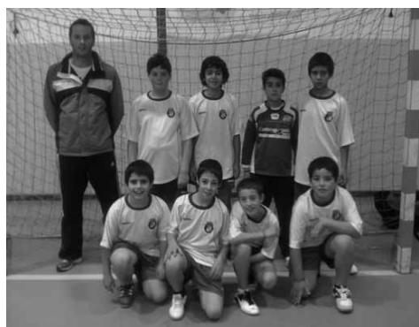
ARQ. C. M. VOUZELA

Os resultados foram o menos importante pois alguns dos atletas