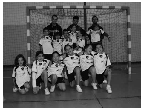
ARQ. C. M. VOUZELA

mais novos estão a dar os primeiros passos no andebol e no desporto em geral e assim desfrutaram de mais uma boa experiência desportiva. Fonte: Gabinete de Imprensa do Município de Vouzela