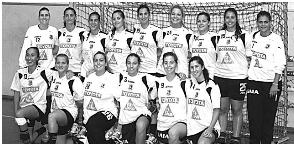
Colégio de Gaia está em segundo no campeonato

para a Challenge Cup. Os jogos estão marcados para as 17h30 no pavilhão do Col. de Gaia.