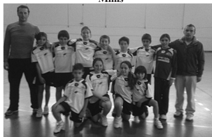
Os minis da equipa de S. Miguel do Mato venceram por 8-5

No sábado, 3 de novembro, os minis da equipa de S. Miguel do Mato deslocaram-se a Penalva do Castelo para defrontar a equipa dos “Melros” de S. Germil. O jogo marcou a estreia de alguns atletas dos Bambis que assim vão tendo oportunidades de realizar mais jogos, o que é fundamental para os mais novos. O resultado foi favorável à equipa de S. Miguel do Mato que venceu por 8-5. Apesar da vitória, o jogo foi bastante difícil devido às faltas de concentração da equipa ao longo do jogo. A exceção foi a parte final do jogo, nos últimos 5 minutos, onde a equipa conseguiu recuperar a diferença de 2 golos de desvantagem e alcançar a vitória final.