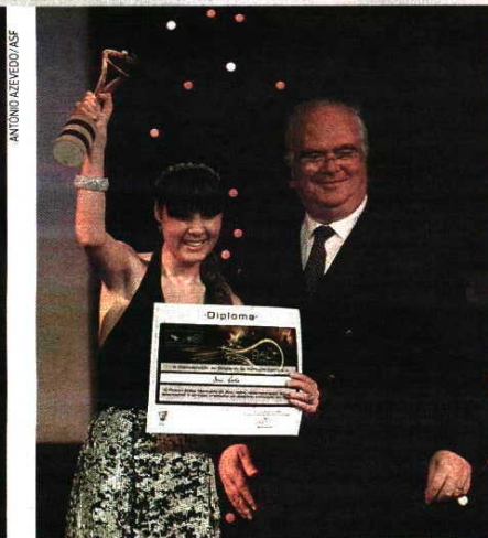
Jéssica Augusto revelou o desejo de ser campeã olímpica como Rosa Mota; namorada de Rui Costa (ciclismo) considerou o prémio justo