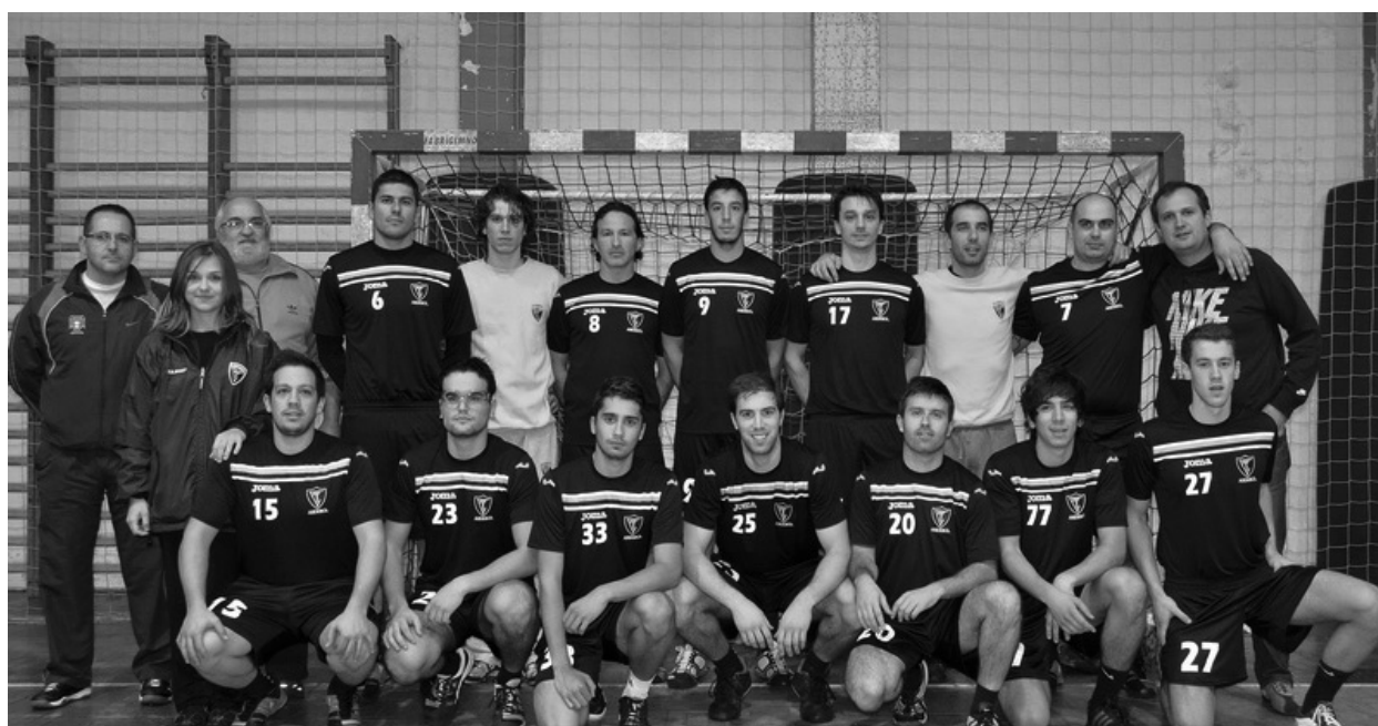
ACADÉMICO DE VISEU continua sem fazer a festa da vitória

Os viseenses ainda conseguiram festejar uma vitória no Campeonato Nacional da 3. a Divisão de Andebol. Nas quatro jornadas que já realizou, ainda só conseguiu dois empates caseiros