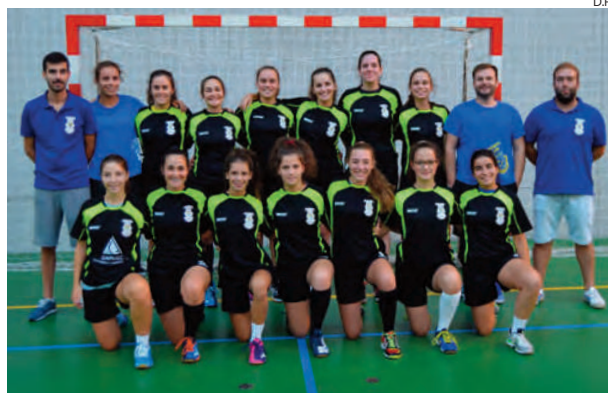
Equipa de Oliveira de Frades recebe o Ílhavo Andebol clube

A turma oliveirense recebe o Ílhavo Andebol Clube e, apesar de jogar frente ao seu público, vai ter de se superar