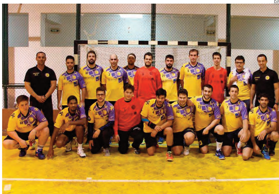
Carregalenses começam a prova em casa frente à Escola de Andebol Falcão Pinhel

1.ª jornada Equipas do distrito começam sábado a “caminhada” para chegar à 2.ª Divisão Nacional, com estreia da Escola de Andebol de Moimenta da Beira