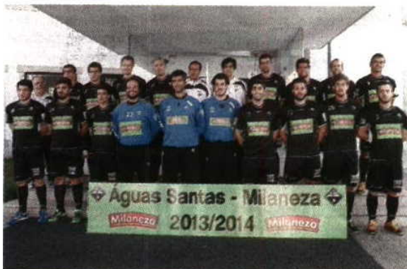
A postos - Águas Santas, com sete reforços, ataca 2013/14

Com quatro reforços provenientes do Madeira SAD, Fafe e São Mamede e cinco juniores, o treinador dos maiatos diz que será preciso tempo para os novos jogadores se enquadrarem na equipa, mas haverá diversos testes para estarem prontos para a estreia.