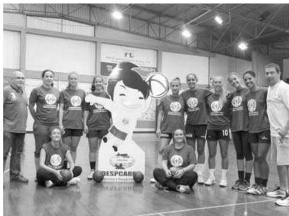
Equipa feminina arrancou a época 2013/2014.