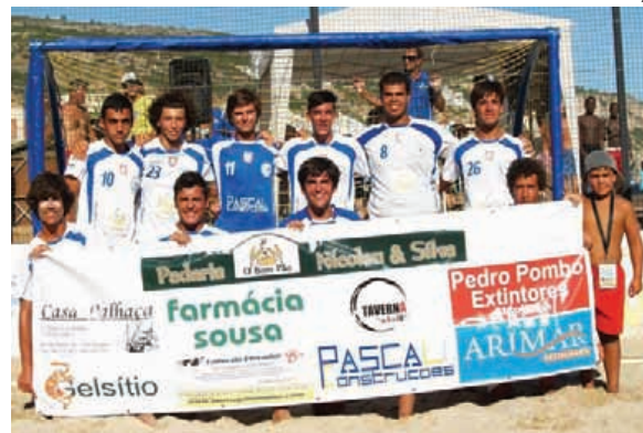
Raccoons d'Areia, Tátási Team, Estupi10 e 100ondas (em baixo) açambarcaram os títulos nacionais para Leiria