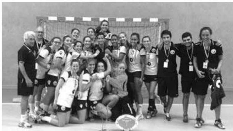
Selecção conquistou recentemente um torneio em França.

Terminada a fase de grupos, as duas primeiras classificadas seguem para a fase denominada por 'Main Round', onde vão cruzar com as duas primeiras do Grupo B - Dinamarca, França, Holanda e Montenegro; as terceiras e quartas classificadas seguem para a fase intermédia da competição. P. V. L.