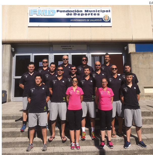
Comitiva do S. Bernardo/Knock-Out que se deslocou a Espanha

O S. Bernardo/Knock-Out ombreou com mais 15 equipas, todas elas espanholas e, claramente, a qualidade foi elevada. Os veteranos portugueses ficaram inseridos no Grupo D, com Navarra, San Carlos e Virgen Europa. Era essencial entrar bem no primeiro jogo, até porque cada partida era de tempo reduzido, tornando a margem de erro muito curta. No primeiro encontro, o adversário foi o San Carlos, equipa ao alcance dos “homens de rosa ao peito”, só que a finalização foi desastrosa, marcando seis golos em 19 remates, contra a boa eficácia dos espanhóis de San Carlos, que tiveram nove remates certos. Depois deste desaire, nada melhor do que um bom período de descanso antes do jogo se-