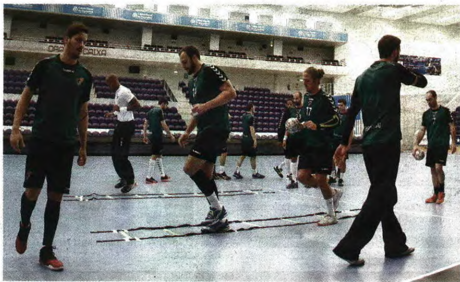
A Seleção Nacional fez ontem, ao início da noite, o último treino no Dragão Caixa

A derrota, por 26-23, do passado domingo em Reikeyjavique tem de ser revertida hoje, no Dragão Caixa, pela Seleção Nacional frente à Islândia, para poder ter acesso ao Mundial de França'2017