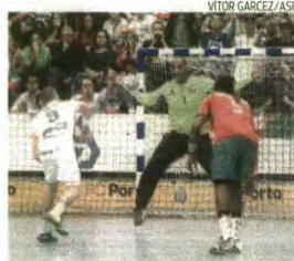
Quintana esteve soberbo na baliza