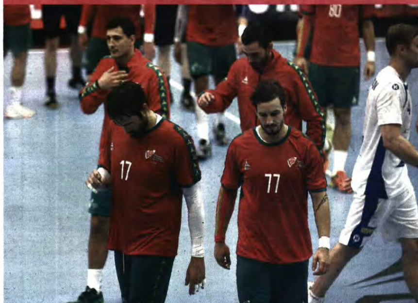
DESILUSÃO. Portugueses não esconderam a tristeza no final do jogo

guardião Quintana a consolidar a manobra do ataque nacional, já que as suas defesas foram fundamentais para o coletivo conseguir cavar a vantagem de três golos (10-7) com que a partida chegou ao intervalo.