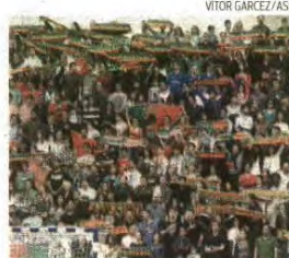
Público não poupou nos aplausos à Seleção