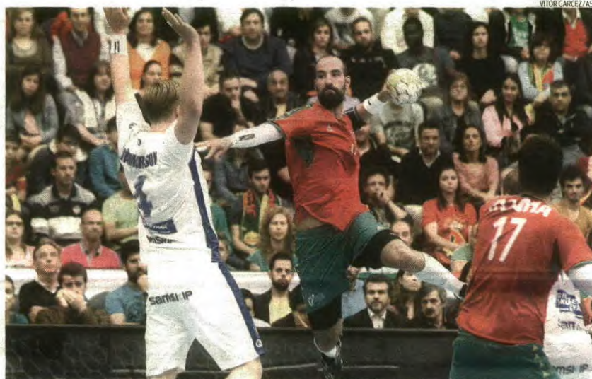
Vitória por um golo sobre a Islândia não chegou para concretizar os intentos de qualificação

Vitória de Portugal (21-20) no Dragão, insuficiente para anular a desvantagem de três golos trazida da Islândia. Derradeiros minutos voltam a ditar afastamento de uma grande competição