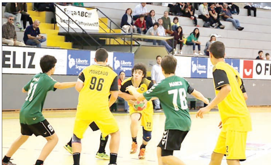
Um pormenor do encontro que o ABC disputou, e venceu, ontem

Nos encontros disputados ontem, destaque para o Arsenal da Devesa que, em masculinos, venceu a ADC Benavente por 18-16, o mesmo se podendo di-