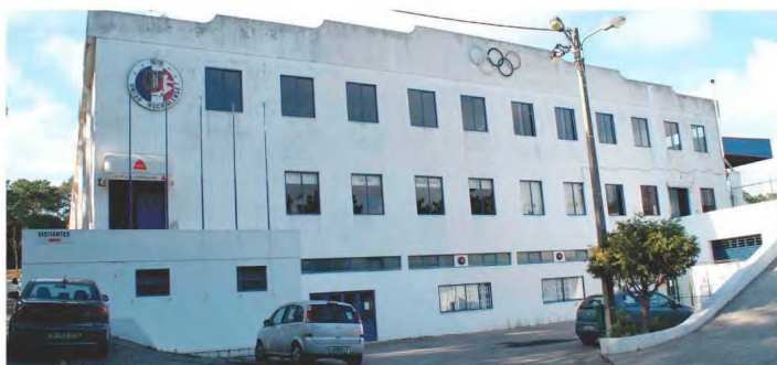
As Festas do Mucifal vão voltar a este espaço na última semana de julho

Neste momento o clube reúne 150 jovens atletas distribuídos pelos escalões de petizes, traquinas, benjamins, infantis, iniciados, juvenis e juniores que ao longo desta época têm demonstrado um excelente desempenho. “Os juniores e os juvenis estão com