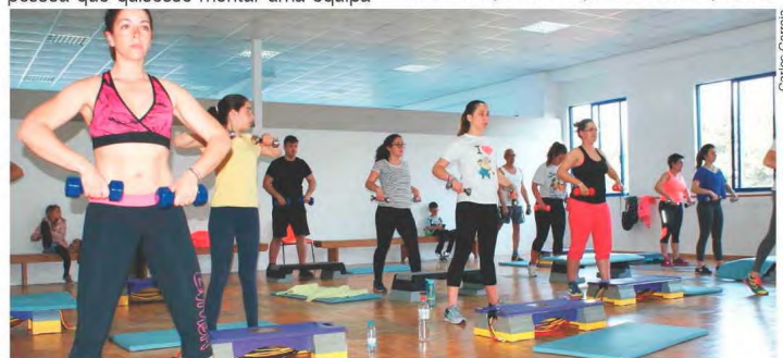
Global Fitness é uma das ofertas deste clube

O clube é composto por três secções: futebol e judo de formação e competição; uma escola de música com uma banda fi-