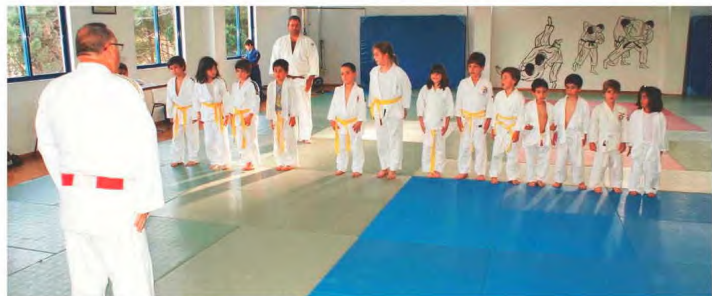
O judo tem escalões de formação e de competição

Neste momento e, pela segunda vez consecutiva, decorre o torneio de futsal João Paulo Cristo com jogos todos os sábados até 18 de junho e cuja final será disputada