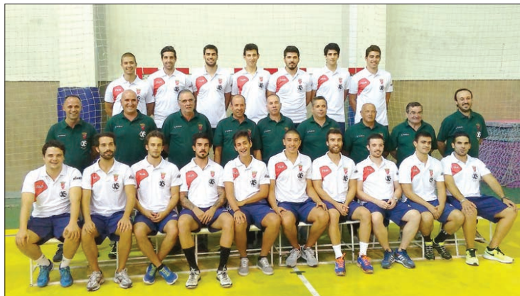
Arsenal apenas depende de si para subir à I Divisão nacional de andebol