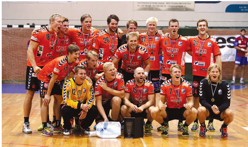
O IFK Kristianstad arrecadou o troféu em Avanca, vencendo o ISMAI na final