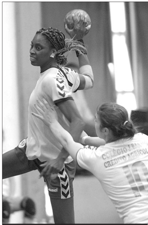
SAD feminina goleou equipa do Porto Salvo.

As duas equipas da Madeira tiveram ontem desfechos diferentes nos jogos na jornada do Nacional de andebol feminino. O Madeira SAD venceu com alguma facilidade o Porto Salvo por 42-10, num jogo totalmente dominado pela equipa de Duarte Freitas e perante um adversário de fracos recursos. Na primeira parte a superioridade das insulares surgiu com facilidade adiantaram-se no marcador, com 17-5 ao intervalo. A sociedade insular continuou a mandar no jogo perante um adversário sem argumentos e sem qualidade para estar a competir nesta divisão e o resultado final espelha isso mesmo. Um jogo onde o técnico das madeirenses fez alinhar todas as jogadoras disponíveis.