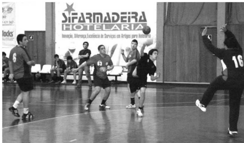
Académico conseguiu uma importante vitória diante do Infante e está perto do título em iniciados.

Em termos de estreia há a destacar o regresso do escalão denominado por categoria única às provas madeirenses. Neste caso os juniores do Académico e da Bartolomeu Perestrelo, bem como os seniores da B. Perestrelo são as formações que abrilhantam o arranque da Taça