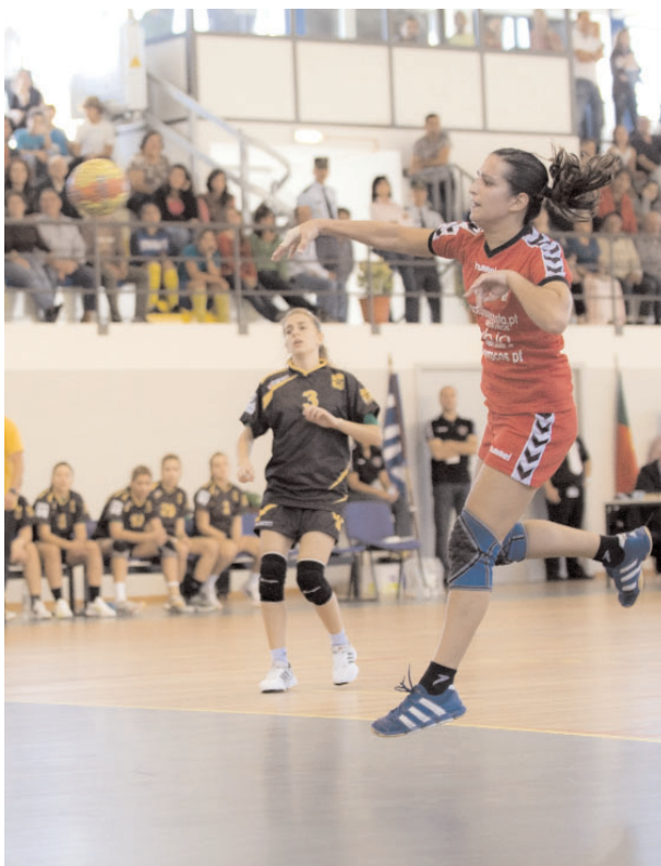
EQUIPA da Juve Lis tem dois empates e duas derrotas na fase final

A formação insular tinha obrigação de vencer, dado que tinha empatado na última jornada, diante do Colégio João de Barros pelo que tinha que con-