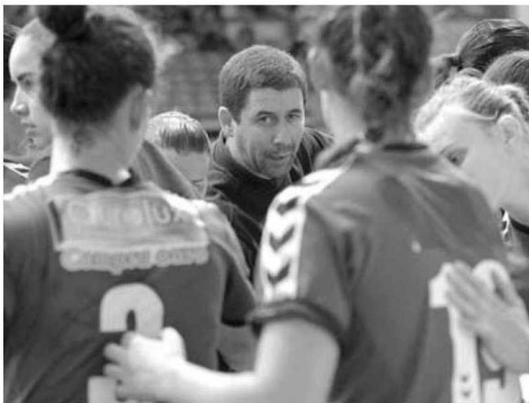
Exibição do Madeira SAD a roçar a perfeição.