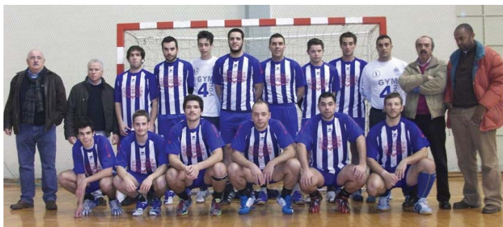
ADA ficou aquém das expetativas, mas lançou jovens da formação

Considera que está a ser um ano de aprendizagem para os jovens e que não aguarda-