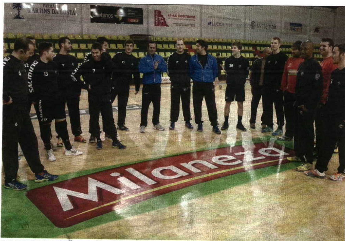
Sorrisos > Atletas e técnicos do Águas Santas antes de começar o treino de ontem