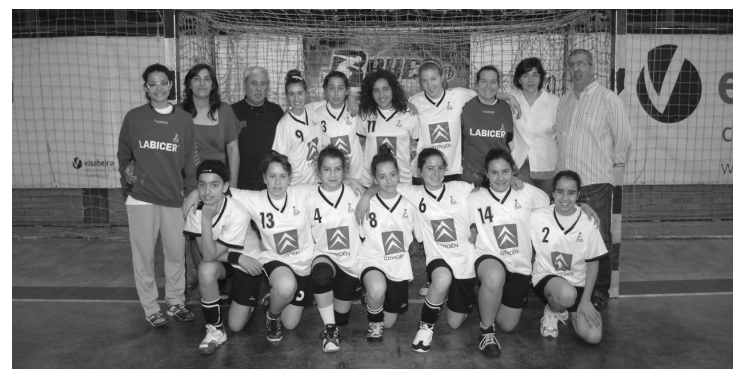
A LAAC, com algumas jogadoras infantis, não evitou a última posição