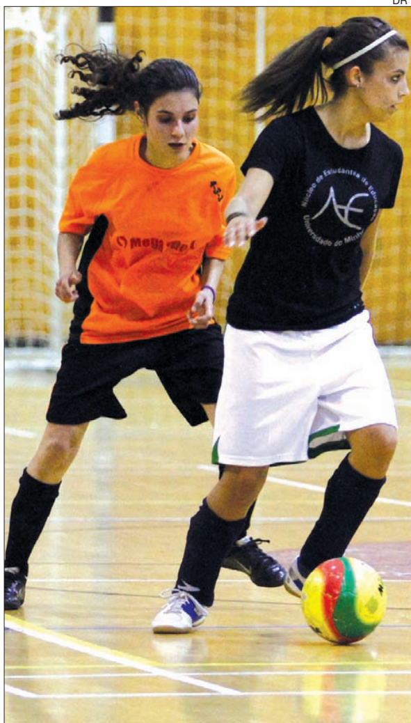
Futsal feminino em ação

No futsal masculino na primeira meia-final da noite, LEI defrontou Eng. Biológica num jogo impróprio para cardíacos que só a lotaria das penalidades resolveu a favor de Biológica que acabou por vencer por 6-5.