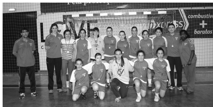
O SÃO BERNARDO, sem estatuto de favorito, acabou por disputar o título

O clube aveirense esteve perto de surpreender na Fase Final Nacional da II Divisão Nacional de Iniciadas Femininas. A LAAC, algo desfalcada, acabou por terminar na última posição