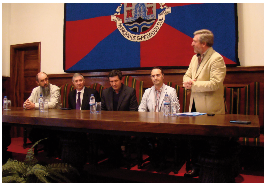
CERIMÓNIA decorreu no Salão Nobre da Câmara de S. Pedro do Sul

As equipas que vão participar na fase final são o clube anfitrião, a Associação da Pais do Agrupamento de Escolas de S. Pedro do Sul, Clube Andebol de Leça, Valongo do Vouga, JAC (Alcanena) e Bartolomeu Pere-strelo (Madeira).