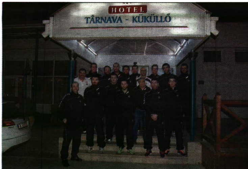
Cansados - Equipa do Águas Santas já em Odorhei, após 19 horas de viagem