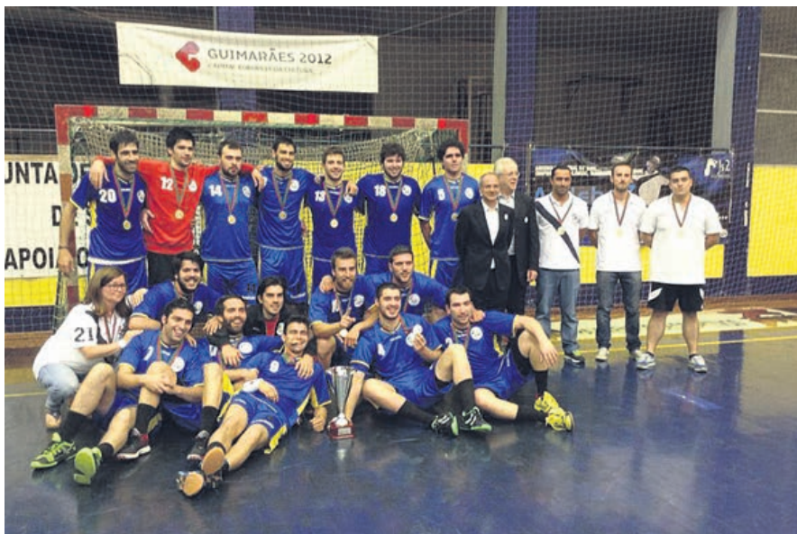
No último jogo da época, com o Benfica B, o Xico Andebol conquistou mais uma vitória e recebeu a taça e as medalhas de campeão

O executivo municipal exulta com os sucessos alcançados por todas as equipas vimeirenses já que os êxitos alcançados vão permitir que Guimarães volte a marcar presença nos principais campeonatos desportivos das modalidades mais praticadas em Portugal: futebol, andebol, basquetebol e voleibol.