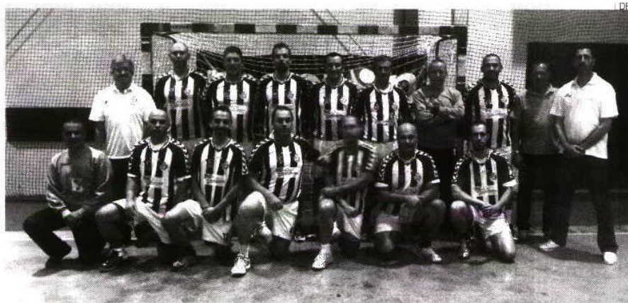
Os jogadores veteranos do Vitória vão disputar o título nacional do escalão