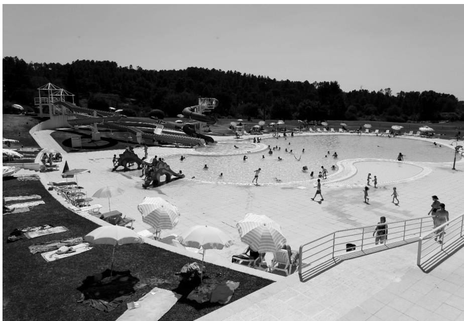
Complexo Desportivo Príncipe Perfeito recebe várias actividades

O programa conta ainda com patinagem no gelo, partidas de bowling e uma noite de campismo (opcional), que inclui jantar, dormida nas tendas, pequeno-almoço, uma prova de orientação e slide nocturno. Os mais aventureiros poderão dedicar-se aos desportos de aventura no Radical Park, a par com outros momentos mais lúdicos e culturais, como workshops de culinária ou de Ciência Activa e as manhãs Fnac.