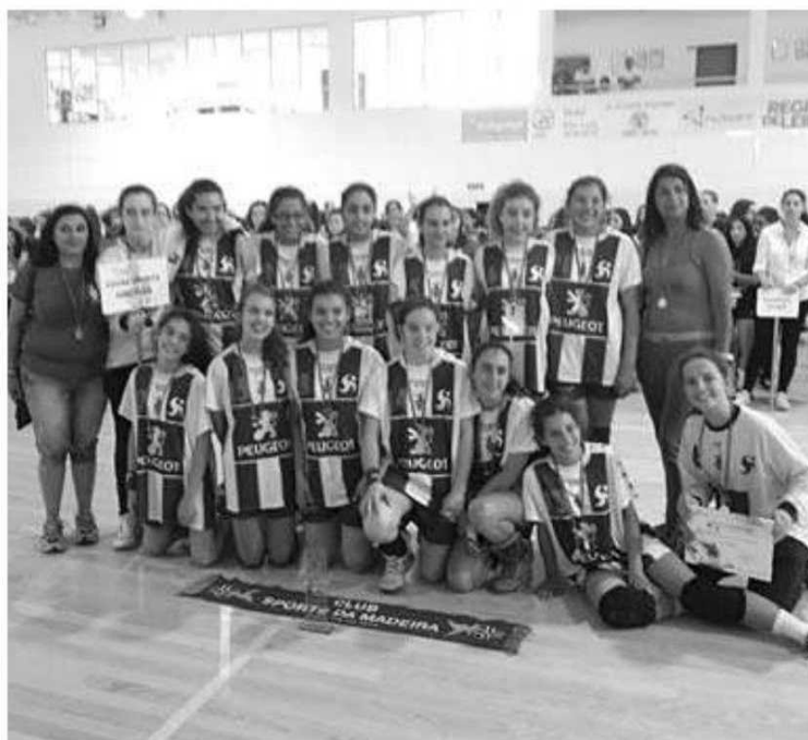
A equipa do Sports Madeira veio para casa com taça e medalhas.

“Estamos todos de parabéns pois este resultado representa muito trabalho e toda a dedicação do Sports da Madeira dá à formação. Fomos uma equipa muito forte, mais forte do que outros candidatos, pois este encontro nacional estiveram equipas muito boas em representação de clubes que também trabalham bem a formação. Este desfecho é um justo prémio para um grupo de jovens, que relembro, treina três vezes por semana num ringue sem muitas condições. A sua dedicação foi agora compensada com este resultado.”