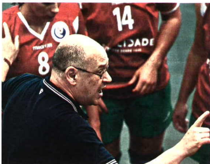
MOTIVAÇÃO. João Florêncio lidera equipa muito ambiciosa

Rumo a Angola. O Mundial de sub-20 na Croácia vai ser “o último ato de João Florêncio enquanto selecionador nacional feminino. O técnico tem “tudo acordado”, segundo o próprio, para assumir o comando da seleção principal feminina de Angola, 11 vezes campeã africana. “É um desafio muito aliciante e uma honra imensa. Angola tem um potencial enorme”, afirma. J.M.P.