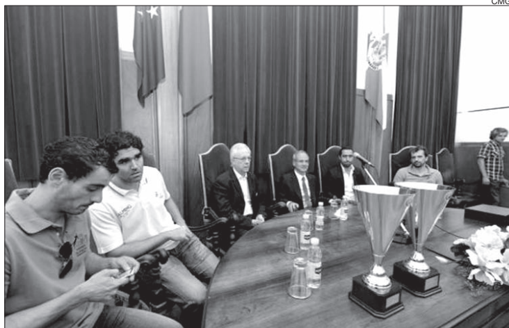
Equipas do Xico Andebol foram recebidas na Câmara de Guimarães