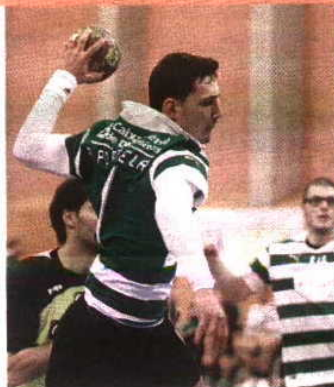
Leões não têm margem para deslizes