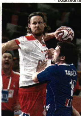
Dinamarqueses bateram croatas e foram 5.º

→ Seleção anfitriã joga primeira partida decisiva numa equipa fora da Europa contra a França