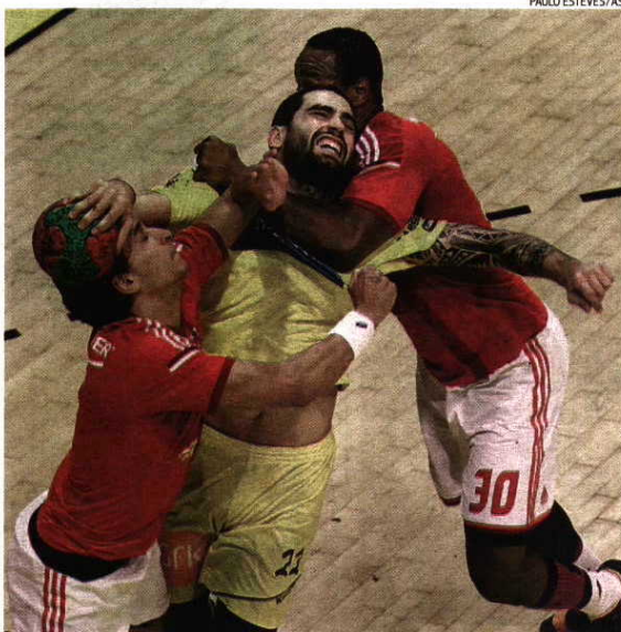
Na visita a Braga Benfica não conseguiu retirar o ABC do 3.º lugar da classificação

dor dos donos da casa, os quais faziam esquecer uns dez minutos iniciais desastrosos. Aos 11.25 m chegaram pela primeira vez à liderança