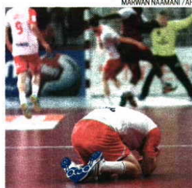
Polacos muito queixosos da arbitragem

O Catar venceu a Polónia por 31-29 na meia-final do Campeonato do Mundo e será a primeira nação fora da Europa a aceder a uma partida decisiva de um Mundial. A jogar em casa, os cataris tiveram, uma vez mais, no guarda-redes Danijel Sa-