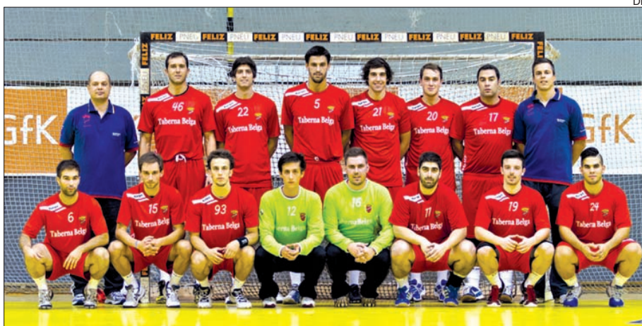
Arsenal da Devesa terminou o ano de 2013 só com vitórias

O Arsenal da Devesa não se cansa de colecionar vitórias no campeonato nacional de andebol da terceira divisão, tendo praticamente garantida a presença na segunda fase da