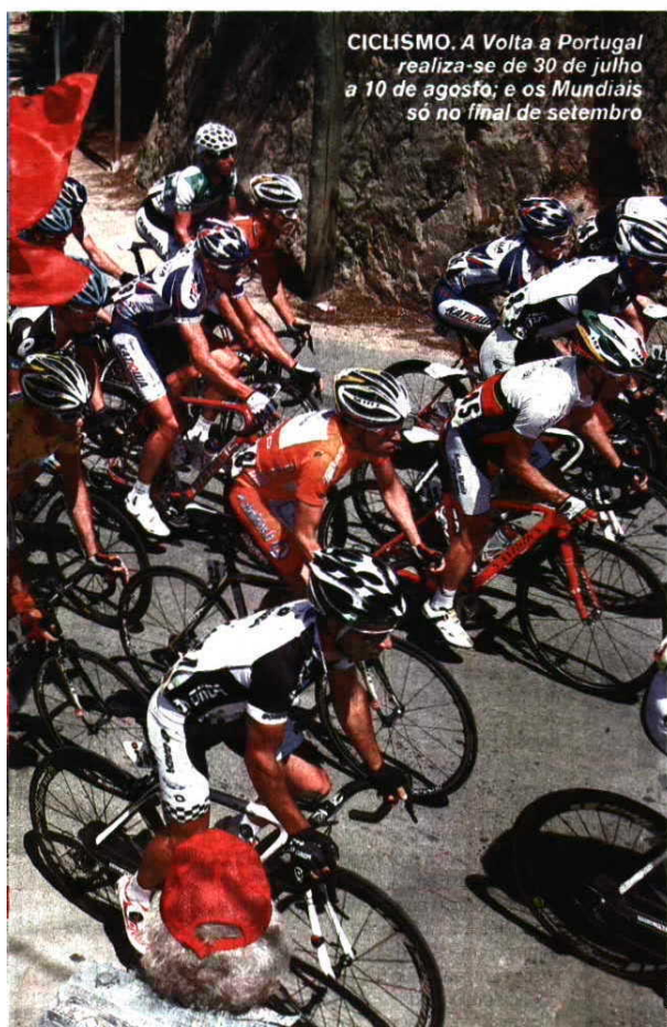
CICLISMO. A Volta a Portugal realiza-se de 30 de julho a 10 de agosto; e os Mundiais só no final de setembro