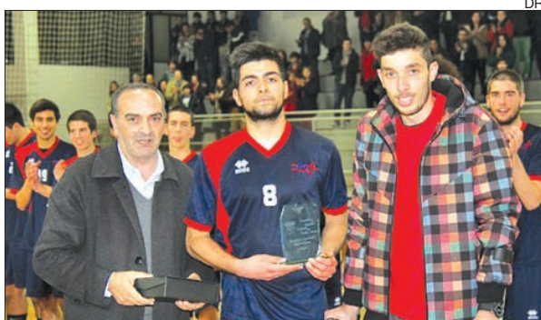
Presidente da AA Braga com o capitão do AC Fafe

O AC Fafe foi o vencedor do Torneio de Natal – Cidade de Fafe 2013, em andebol jovem e disputado no passado fim de semana, nesta cidade. A prova foi organizada pelo AC Fafe, em colaboração com a Associação de Andebol de Braga e, para além da equipa local, contou com a participação das equipas de juvenis do ABC de Braga, Fermentões, Xico, AAPL e Águas Santas.