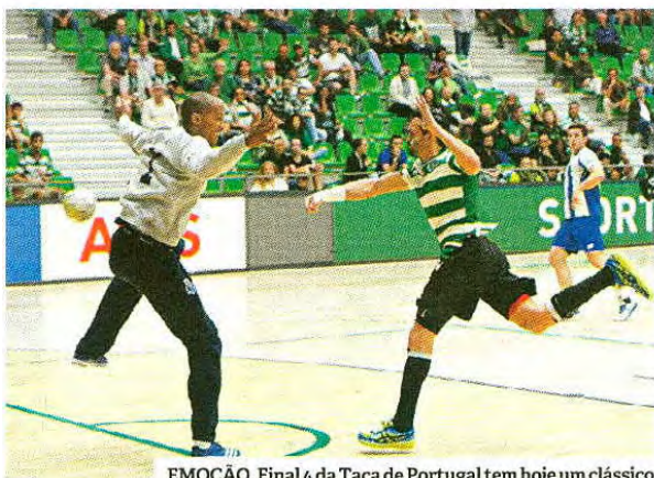
EMOÇÃO. Final 4 da Taça de Portugal tem hoje um clássico