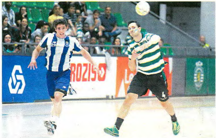
F. C. Porto e Sporting defrontam-se esta tarde numa espécie de final antecipada

Andebol Benfica defronta o Gaia e tem, em teoria, a tarefa facilitada no arranque da final four da Taça de Portugal, que se joga neste fim de semana no Peso da Régua