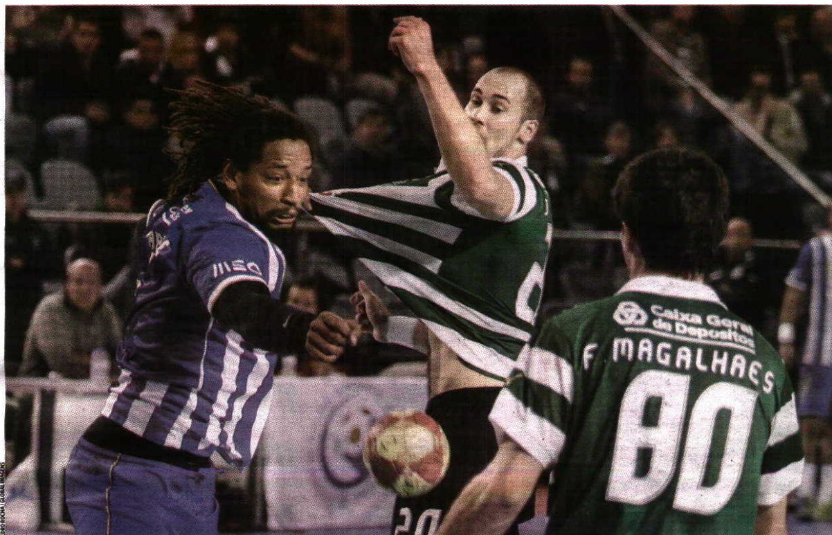
Fol para o campeonato Sporting e FC Porto encontraram-se pela última vez em novembro e empataram a 20 golos