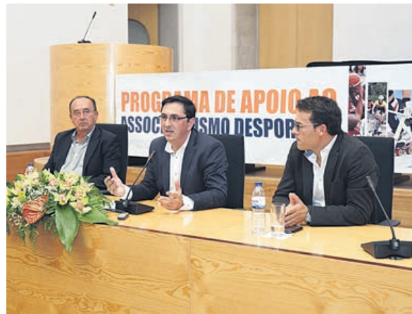
Apoio financeiro do município é muito importante para as associações e clubes

Formalizando o apoio a conceder aos clubes e associações para a sua atividade regular, na época desportiva 2015/2016, o município estabeleceu Contratos