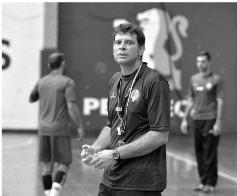
Madeira Andebol joga esta tarde no pavilhão da Luz.