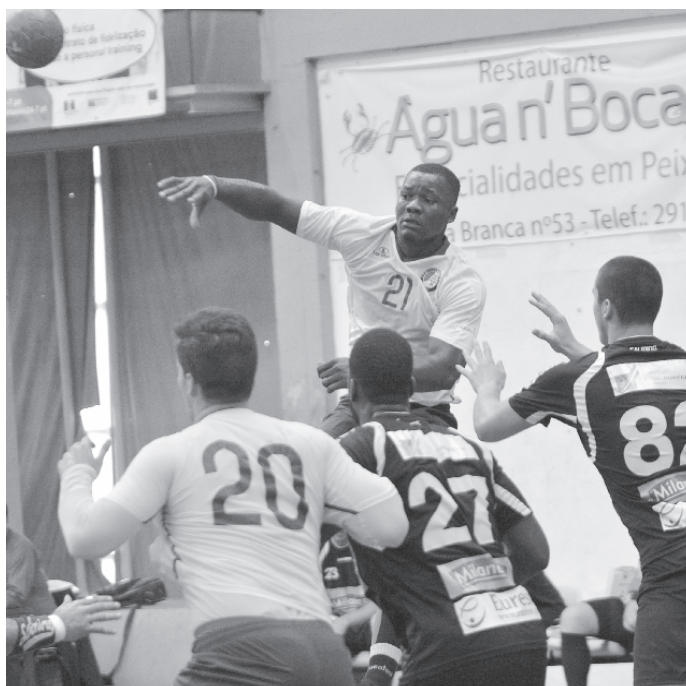
Madeira SAD desloca-se à Luz com o pensamento na vitória.