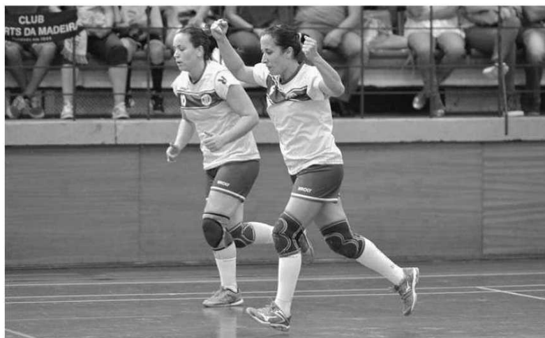
Equipas da Madeira estiveram em bom plano.

Excelente entrada do andebol sé- nior masculino do Marítimo no Campeonato Nacional da II Divi- são, zona norte. Os madeirenses depois da vitória sábado em casa do Módicus, (25-24) agora em