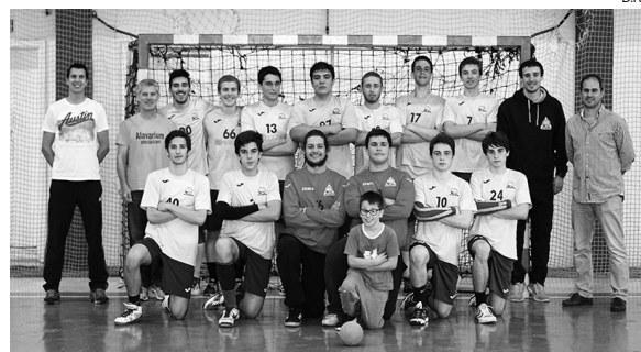
A equipa do Alavarium que conquistou o título regional

De salientar que esta equipa, que disputou este regional, já integrou jogadores que no próximo ano vão subir ao escalão de Juvenis, abrindo boas perspectivas para o Campeonato Nacional da 1.ª Divisão na próxima época. ◀