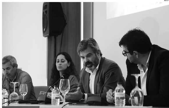
Organização acredita no sucesso de mais uma edição do torneio

Desde o seu torneio em 2010, apenas com a participação equipas da região de Aveiro, o torneio foi-se alargando a um universo mais vasto de clubes e cresceu de forma abissal, sendo hoje já uma referência internacional. De ano para ano, com o aumento do número de clubes e de participantes, têm sido milhares as pessoas que visitam Estarreja, já que, para além da componente desportiva, o evento dispõe de uma panóplia de actividades lúdicas e de en-