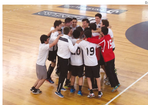
Jogadores da Artística festejam a conquista do título nacional

Contrariamente ao que se tinha visto no dia anterior, a Artística de Avanca, na manhã de domingo, esteve muitos furos acima daquilo que fez diante do conjunto açoriano e, apesar de não ter entrado muito bem - es-