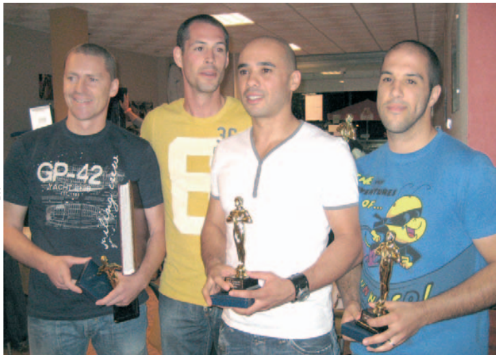
ANDEBOL - Os distinguidos com os óscares atribuídos pelos amigos do andebol

Como ponto alto deste jantar convívio a equipa organizadora resolveu,