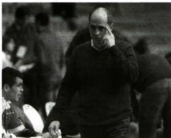
Fim de ciclo > Saída de JAS oficializada apenas ontem