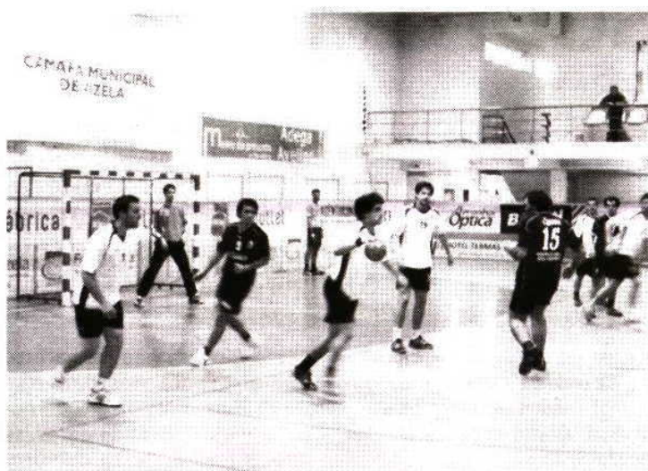
Melhor exibição ficou guardada para o último jogo do campeonato