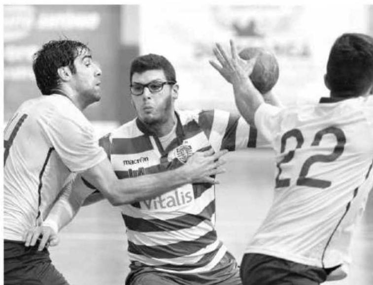
Madeirenses deram boa réplica aos leões.