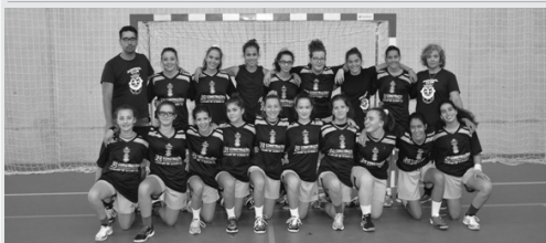
A equipa oficial na categoria dos juvenis femininos.