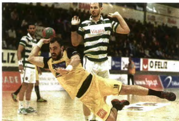
AO ATAQUE. Eficácia do ABC surpreendeu os leões