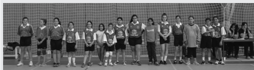
Os atletas que compõem a categoria dos infantis femininos.