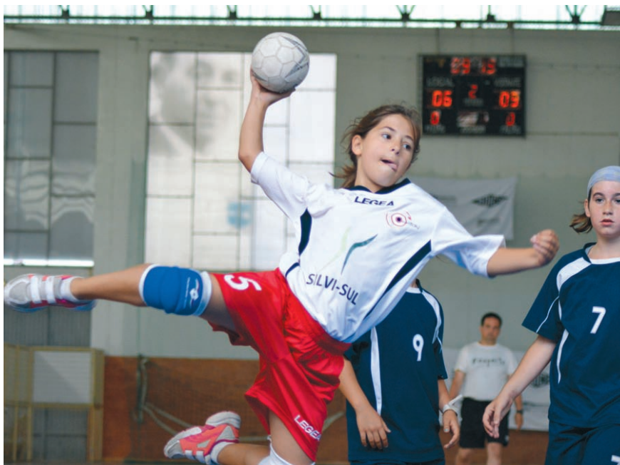
■ Associação Cautchú tem cerca de 70 atletas federados, mais de metade são raparigas

O projecto acabou por nascer em Dezembro de 2013 e logo com uma característica muito particular: a sede da associação está em São Teotónio, mas a associação também