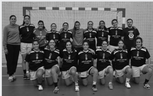
A equipa sénior que está a disputar o campeonato nacional, na segunda divisão.