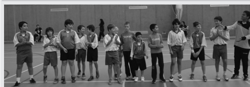
A equipa que joga na categoria infantis masculinos, que teve início este ano.

No passado fim-de-semana, dias 10 e 11 de Outubro, os vários escalões do Andebol Clube de Oliveira de Frades iniciaram os jogos para o campeonato, no pavilhão municipal. Este ano a modalidade trouxe algumas novidades, como a criação do escalão infantis masculinos que está em competição no campeonato nacional. Outra boa nova para esta época foi a entrada da equipa sénior feminina na competição a nível nacional, na segunda divisão.