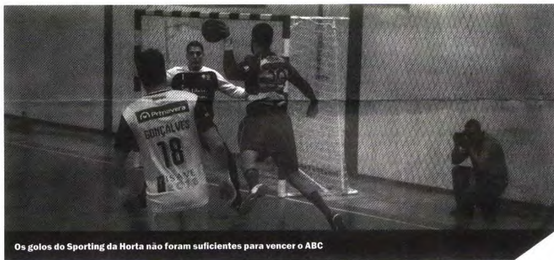
Os golos do Sporting da Horta não foram suficientes para vencer o ABC

Na segunda parte, o ABC de Braga voltou a ser o primeiro a marcar e continuou a ter vantagem sobre a equipa da casa, o que fez com que a