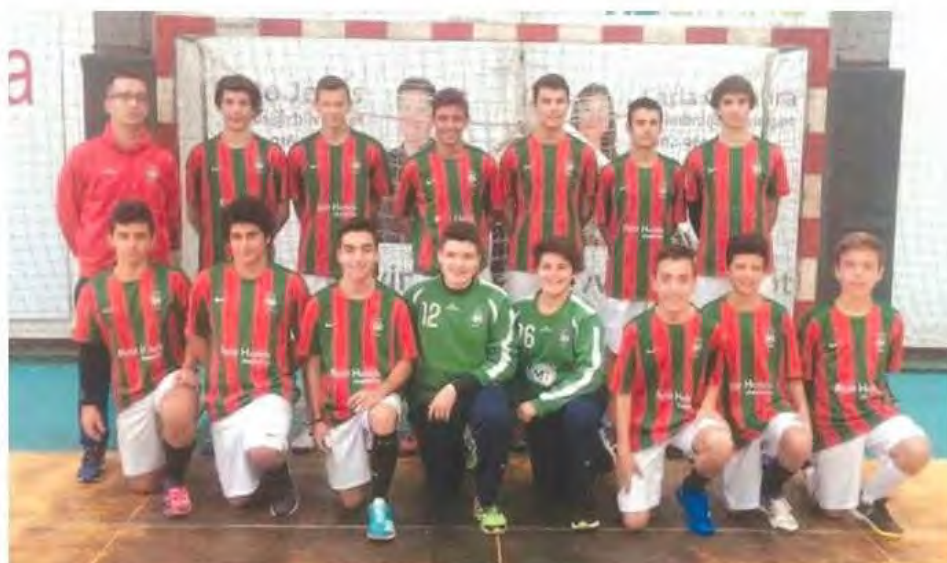
Verde-rubros jogam apuramento para a fase final nacional em Beja.

Quanto a equipa de iniciados verde-rubra, rumo até Beja, onde integra a zona 2 da fase de apura-