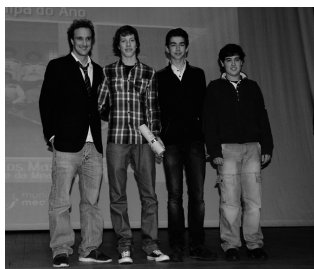
Iniciados masculinos do HC Mealhada