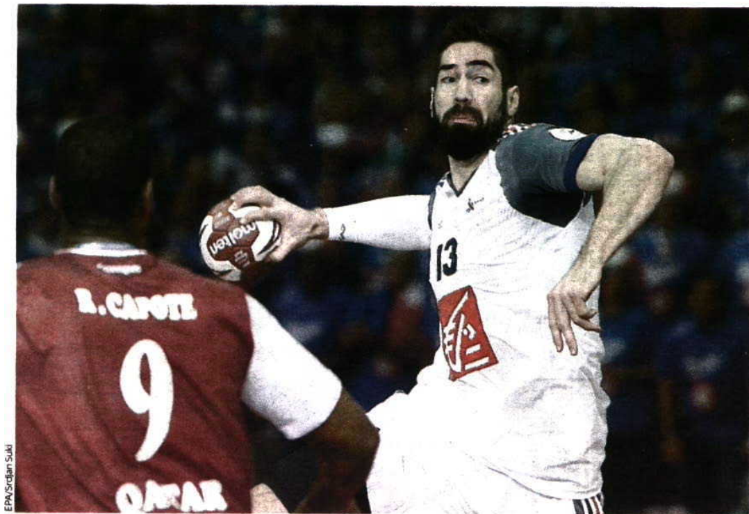
Estrela da seleção francesa de andebol, Nikola Karabatic pode ir a julgamento

ANDEBOL Cinco dias depois de dar o quinto título mundial à França, o melhor central da atualidade soube que terá de ir a tribunal