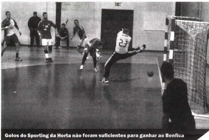
Golos do Sporting da Horta não foram suficientes para ganhar ao Benfica

De referir que depois do jogo de sábado, ficam a faltar apenas três jogos para terminar a 1.ª fase do campeonato de andebol. Assim sendo, depois do Belenenses, o Sporting da Horta irá fora jogar com o Santo Tirso e o Águas Santas e fecha esta fase em casa frente ao ABC a 25 de fevereiro.