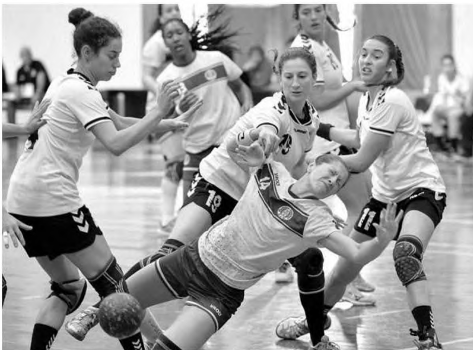
Madeira SAD joga amanhã para garantir um lugar na 'final four' da Taça de Portugal.