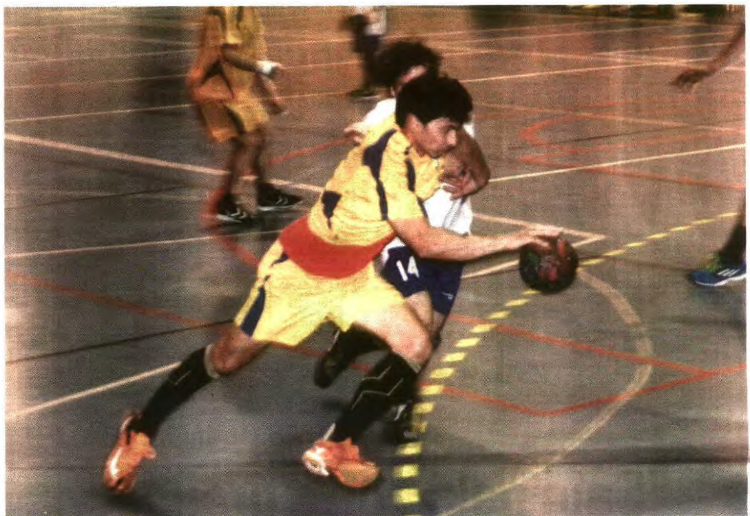
Lider Zona Azul de Beja já lidera a 2.ª fase do Nacional da 3.ª Divisão