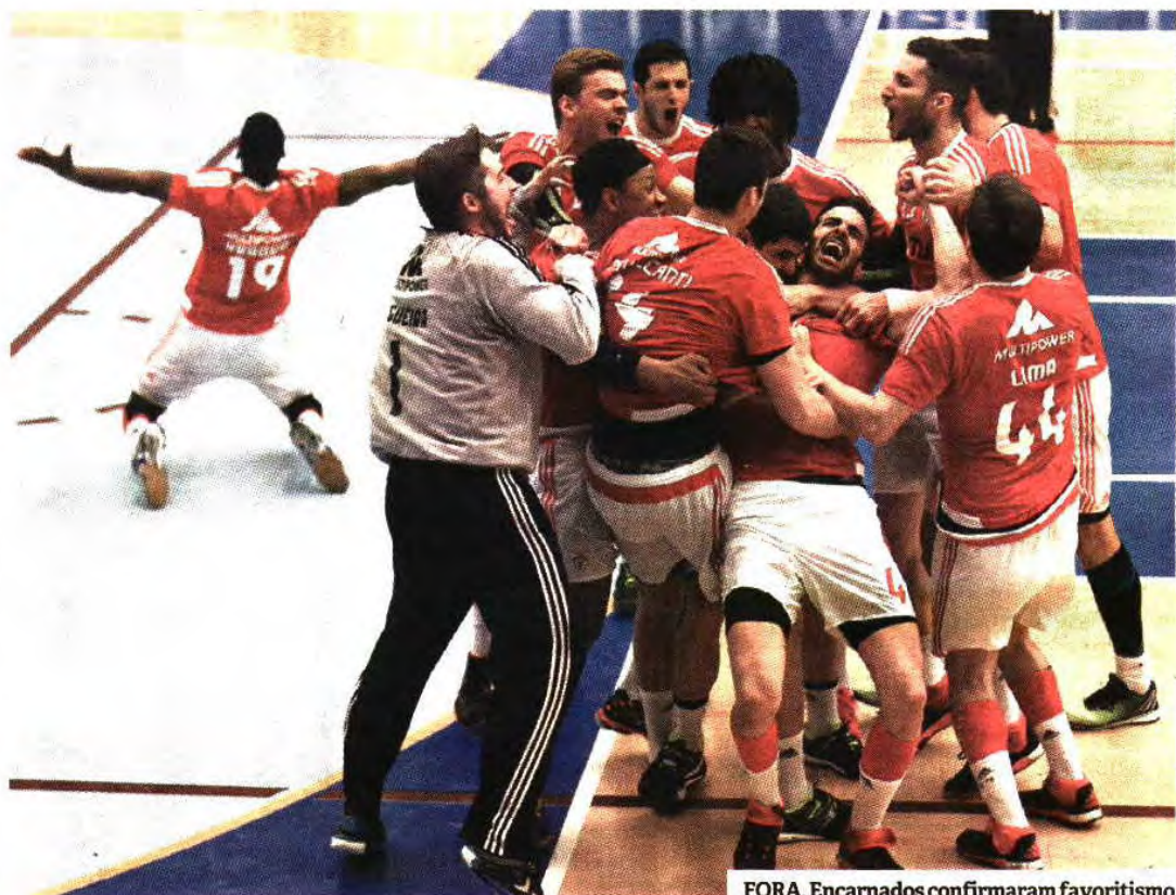
FORA. Encarnados confirmaram favoritismo

Mesmo assim, a turma anfitriã não se rendeu, tentando corrigir a derrota em Lisboa. Perante defesa agressiva, os encarnados levaram tempo a descobrir o caminho da baliza adversária, ao marcarem o primeiro golo apenas aos