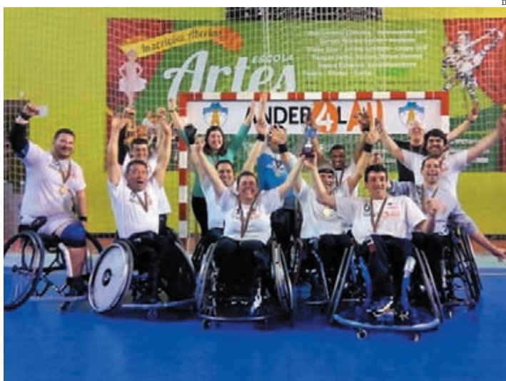
Mais um título, mais uma festa

Logo de manhã, na meia-final da competição, começou por eliminar a APD Lisboa, por 19-12. À tarde o jogo foi frente ao Sporting, equipa que chegou ao jogo decisivo sem ter de jogar o acesso à final por desistência da APD Braga. Leiria foi outra vez mais forte, venceu por 16-8, e festejou com ale-