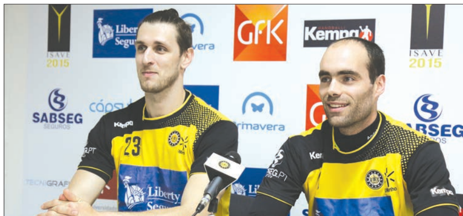
Rebelo e Vidrigo falaram sobre segundo jogo das "meias"