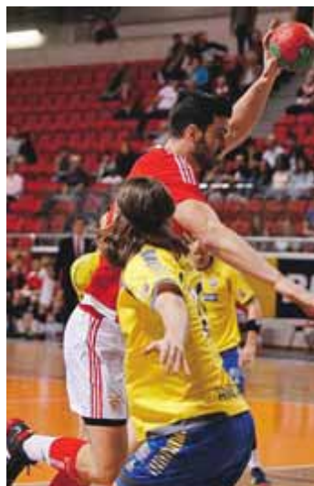
Depois de um 35-22, o Benfica voltou a ganhar (29-27)

Na época passada, já o ABC tinha garantido o acesso à final (em que perderia com os romenos do Odorhei) e hoje tem uma oportunidade de ouro de repetir a proeza. Na primeira mão, os minhotos bateram o Dukla de Praga por 34-33 e nesta tarde tentam defender a vantagem na República Checa. Se o conseguirem, será a primeira final europeia 100% portuguesa na história do andebol.