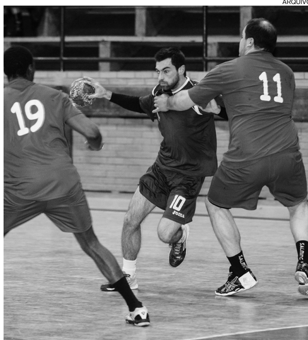
O Andebol no S. Bernardo vive um período de indefinição

De acordo com elementos próximos do processo, deverá ser marcada uma Assembleia-Geral, em princípio para o próximo dia 30 de Maio, por forma a que, nessa reunião magna, os associados presentes possam eleger, por um período de dois anos, a actual Comissão Directiva, uma vez que, conforme o Diário de Aveiro apurou, os ainda dirigentes estão disponi-