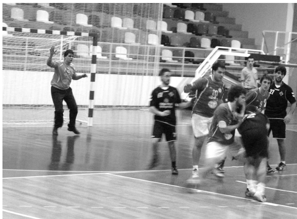
O Tondela AC não só defendeu bem como atacou ainda melhor

Não há forma alguma dos visitantes se desculparem com uma derrota tão pesada.