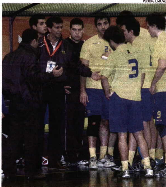
Xico Andebol desloca-se à Alemanha para 2.ª eliminatória da Taça das Taças