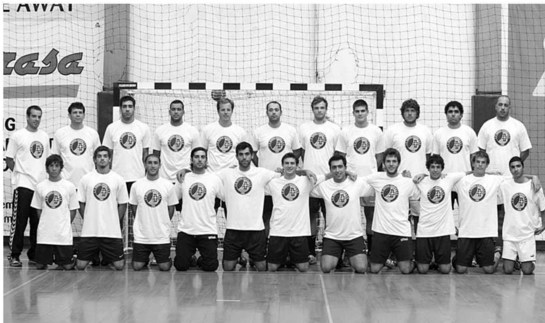
Madeira SAD vai ter um plantel mais curto na nova época.

HERBERTO DUARTE PEREIRA desporto@dnnoticias.pt