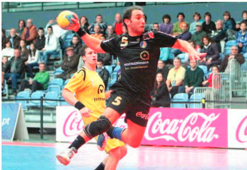
Em termos de estatística o jogador madeirense ocupou o terceiro lugar do ranking nacional.

Fazendo questão de prolongar a sua 'lista' de reconhecimento, Gonçalo Vieira não esquece o trabalho do seu actual treinador: "Te-