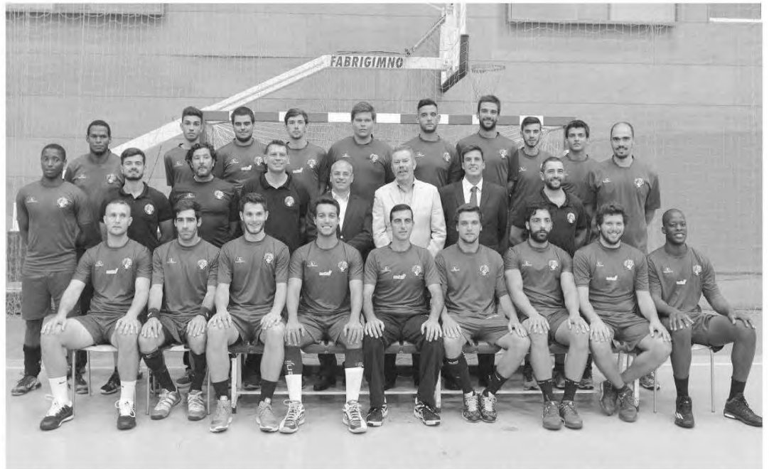
A SAD apresentou-se com o seu habitual equipamento azul, mas irá começar a época com outras cores.

O administrador não se quis alongar muito sobre esta matéria, informando que tudo será esclarecido na apresentação oficial dos equipamentos, mas frisou que não haverá um equipamento principal e um secundário. "Os dois equipamentos vão ser utilizados de forma regular", garantiu, escondendo a cor do 'uniforme' que será utilizado este sábado, às 16 horas, no primeiro jogo oficial da época, no Pavilhão do Funchal, com o Ismael, na