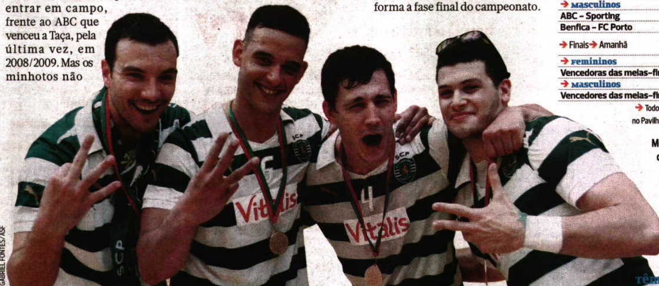
GABRIEL FONTES / ASF