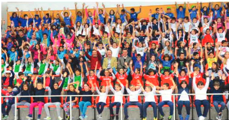
Mais de três centenas fizeram a festa do voleibol do I Ciclo, no Pavilhão do Marítimo.

A Direcção de Serviços do Desporto Escolar fez disputar o voleibol para os alunos do I Ciclo da Região Autónoma da Madeira.