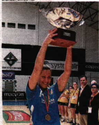
Madeirenses nunca largaram a Taça