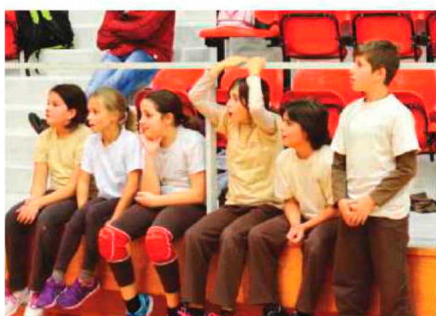
Todos interessados e concentrados no jogo.