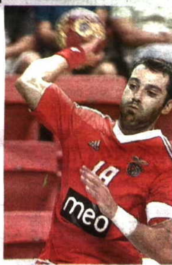
Capitão quer corrigir erros