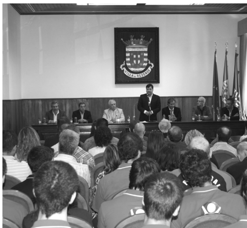
CERIMÓNIA de assinatura de protocolo na Câmara de Resende

■ Continuando a desenvolver a promoção de actividades amadoras de pavilhão, a Câmara Municipal de Resende, assinou um protocolo de colaboração com a Federação de Andebol de Portugal, que irá garantir a presença permanente da selecção nacional de juniores B, na vila de Resende.