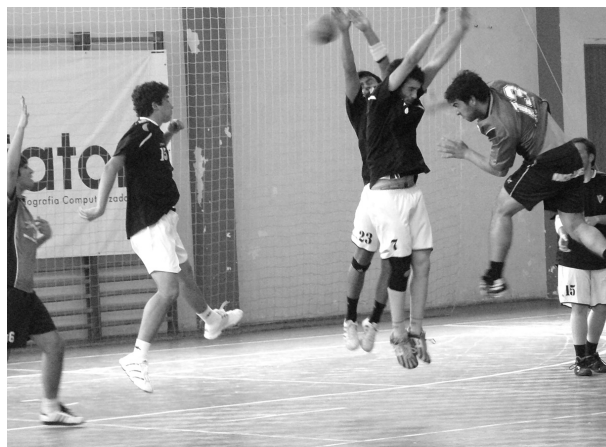
ANDEBOL nacional jovem arrancou no último fim-de-semana

tras modalidades, também no andebol, a crise económica que se faz sentir, a nível global, originou com que a redução de equipas nos diversos campeo-