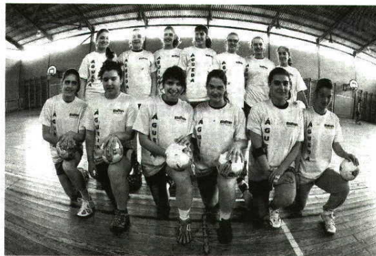
Representantes portuguesas no torneio mundial têm algumas atletas federadas