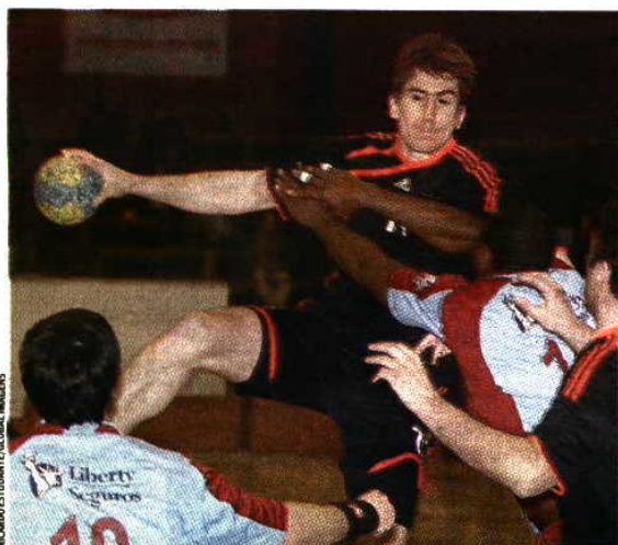
RICARDO ESTIVANTE / GLOBAZ IMAGES