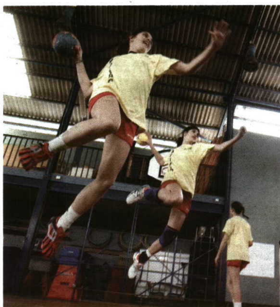
Equipa feminina tem treinado arduamente, para obter a melhor classificação

As escolas estão ligadas a este evento de forma directa e como exemplo do que foi feito pelos alunos da região destaca-se a página da internet, os guias, os secretariados, instalação de infraestrutura de rede informática, a transmis-