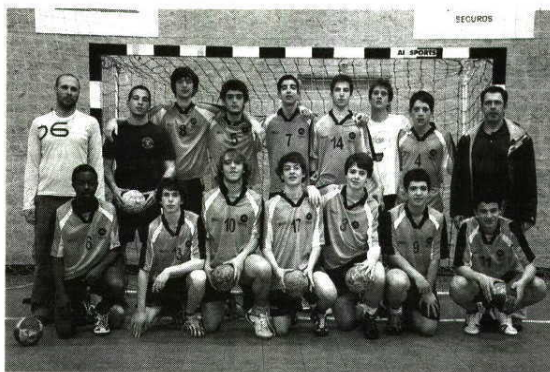
ESAG ficou em 16.º lugar no campeonato do mundo disputado há seis anos na Hungria