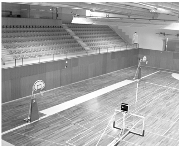
O Pavilhão de Moimenta da Beira vai ser o palco do desafio entre as selecções de seniores femininos de Portugal e Suíça

É importante que o público ocorra em grande número ao Pavilhão de Moimenta da Beira, de modo a apoiar e incentivar as jogadoras para chegarem à vitória sobre a Suíça.