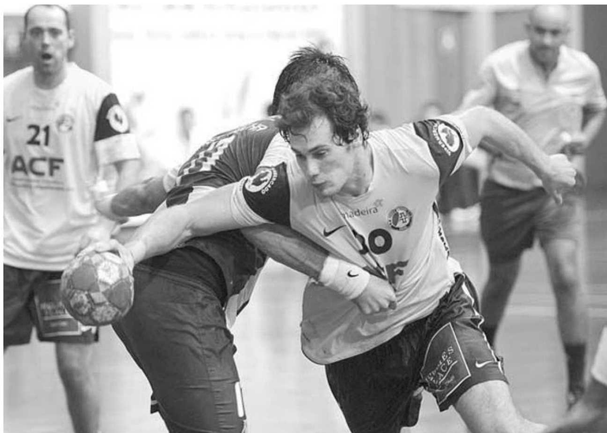
O empate a 24 golos no jogo do Funchal deixa antever muitas dificuldades.