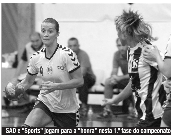
SAD e "Sports" jogam para a "honra" nesta 1.ª fase do campeonato.