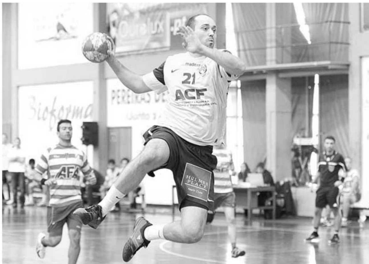
Depois do empate no Funchal, a tarefa do Madeira SAD na Eslováquia era complicada.