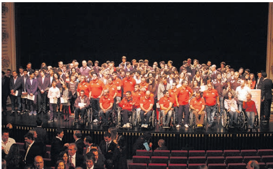
Fotos dos vencedores do ano passado da Gala do Desporto de Braga, que vai realizar-se novamente no Theatro Circo

Reconhecendo o desporto como um factor de elevada importância na promoção e divulgação do nome da cidade e concelho de Braga, quer a nível nacional quer a nível internacional, esta iniciativa levada a cabo pela autarquia visa distinguir publicamente os protagonistas desportivos que em prol de uma modalidade e de um clube, e inclusive do próprio país, alcançaram resultados de mérito ao longo da última temporada, no período