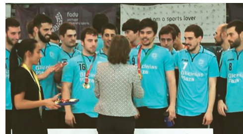
Equipa masculina da AAUAv , campeã nacional de Andebol