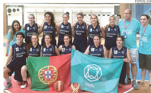
Equipa feminina da AAUAv , campeã nacional de Basquetebol

A equipa feminina de Basquetebol da AAUAv, para além de ter conquistado o título de campeã nacional, ficou ainda no 15.º lugar nos Jogos Europeus Universitários. A formação masculina de Andebol sagrou-se campeã nacional e foi oitava classificada nos Jogos Europeus Universitários. ◀