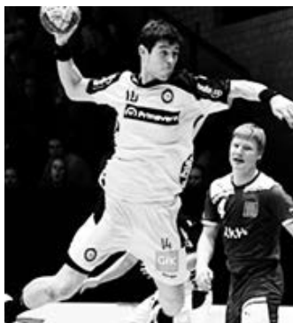
Pesqueira viajou com selecção

O empate basta para Portugal carimbar presença no próximo ano na Dinamarca. Desde 2006 que os portugueses não pisam